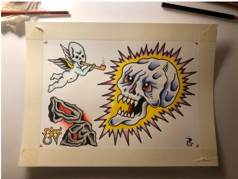
Kuva 10. Harjoittelija Ilari Peltomäki työstää flash-kuvansa perinteisesti musteella tai tussilla ja vesivärillä (Peltomäki, 2023).