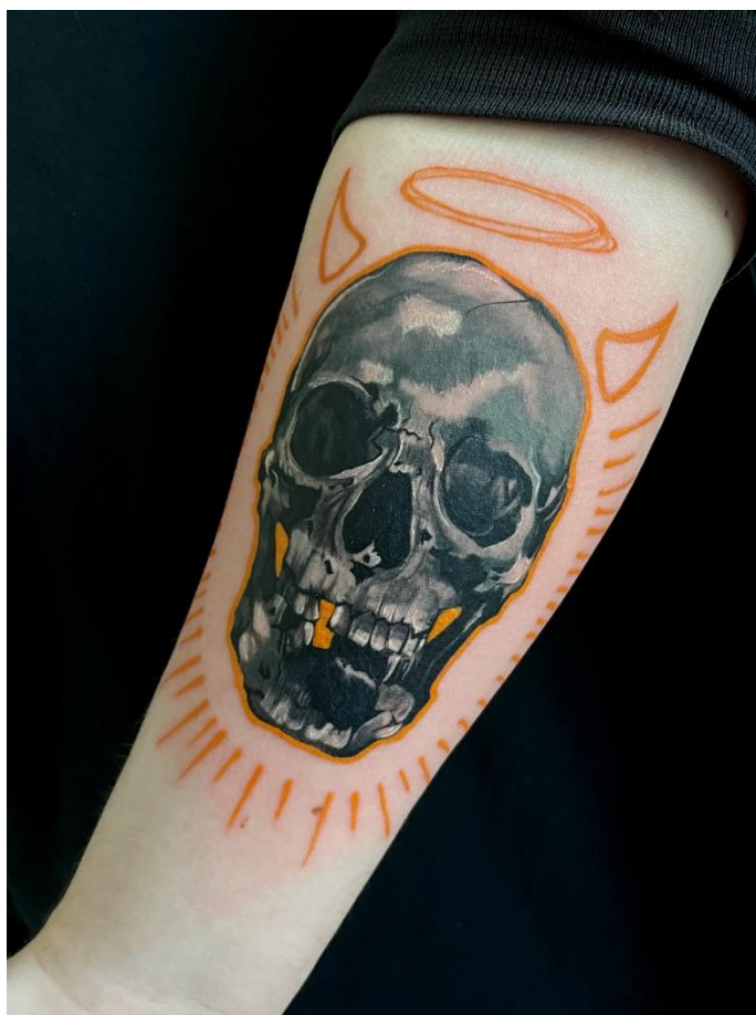
Kuva 6. Yksi viimeisimmistä tatuoinneistani, joita olen harjoitteluajanani tehnyt. Maalauksellisen jäljen luominen niin, että lopputulos näyttää viimeistellyltä tatuoinnilta, on haastavaa, mutta juuri sitä mitä haluan itse tatuointitaiteessani tavoitella.

Tatuointiharjoittelijana taidekoulun viimeisenä vuotena olen pohtinut taiteilijaidentiteettiäni suhteessa tatuomiseen paljon. Uskallan väittää, että tulen aina olemaan ensimmäisenä taiteilija ja taidemaalari, seuraavana tatuoiija vielä harjoitteluajan jälkeenkin, vaikka käytännössä jo elän ja hengitänkin mustetta. Maalauksellisuus pyrkii suunnittelemiini tatuointeihin niin kuin sen on tarkoituskin. Graafiset elementit ovat rakastamani lisä taidegraafisesta tuotannostani yhdessä aksenttivärien kanssa.