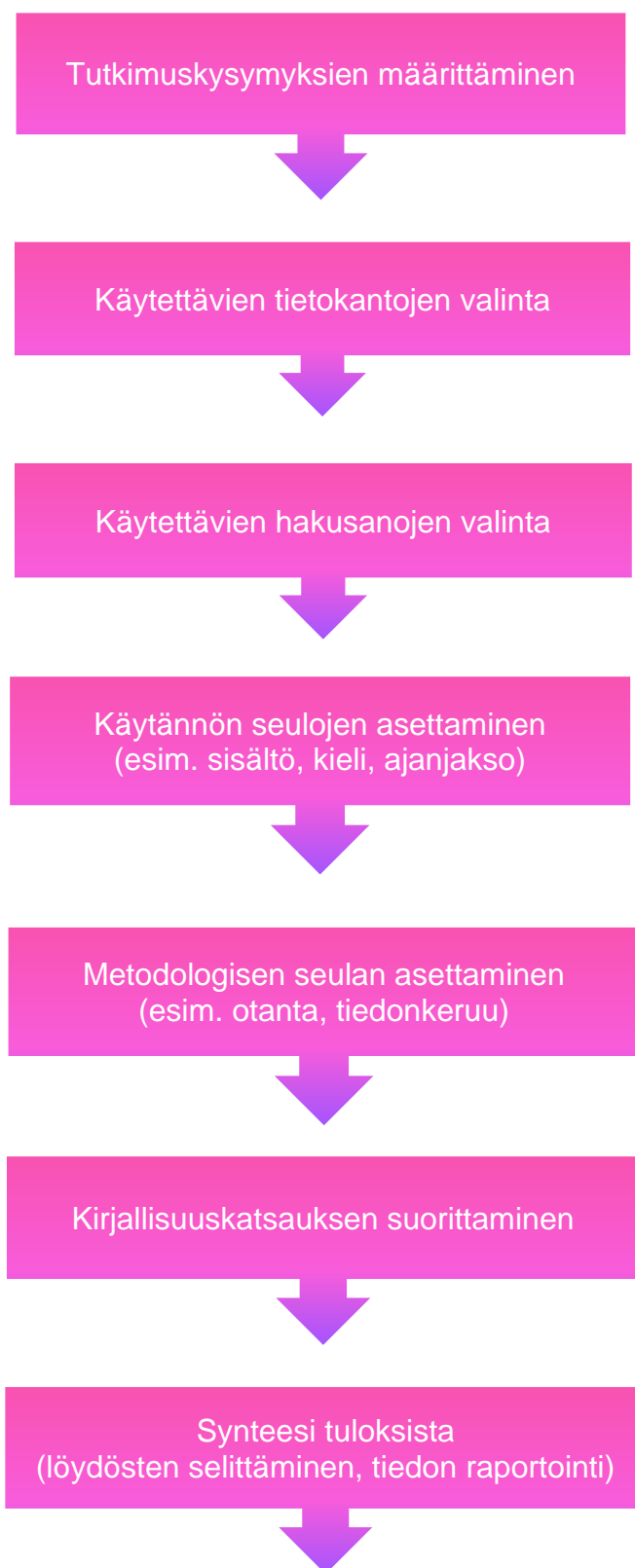
Kuvio 1. Kirjallisuuskatsauksen prosessi. (Mukaillen, Fink, 2020 s. 5; Salminen, 2011, s. 11)