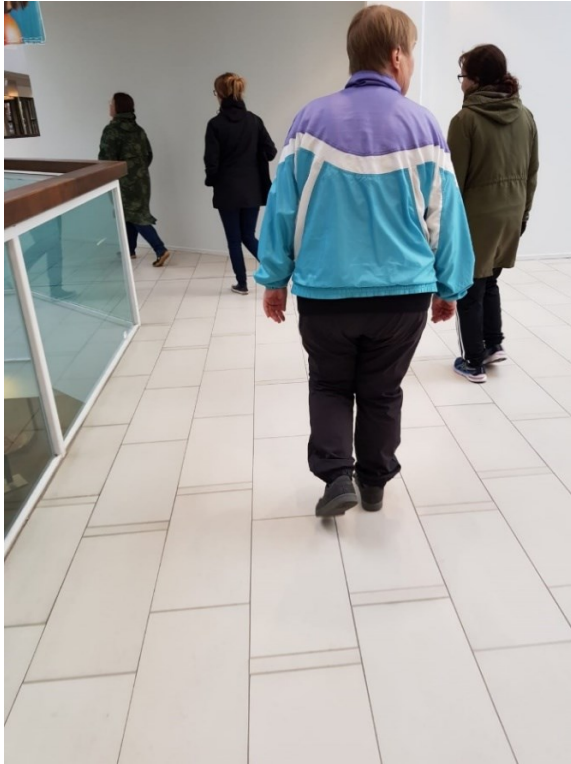
Kuva 2 / Liite 3. Kuuntelukävelyn reitti kulki läpi tyhjän kauppakeskuksen 8.9.2022.