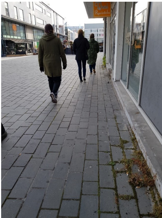
Kuva 3 / Liite 3. Kuuntelukävelyllä kuljettiin erilaisilla katupinnoilla ja erilaisten rakennusten läheisyydessä. Kuva kuuntelukävelyltä 8.9.2022.