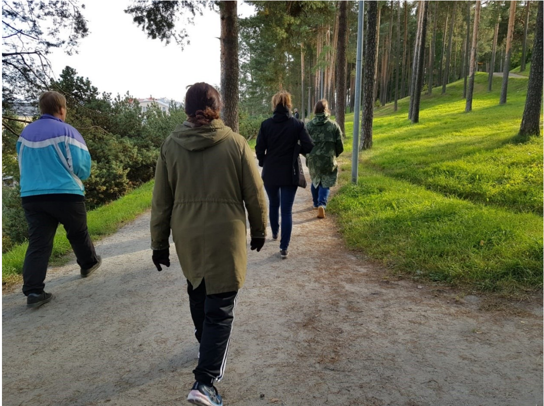
Kuva 1 / Liite 3. Kuuntelukävelyllä Jyväskylän harjulla 8.9.2022.