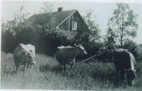
Kesäinen päivä laitumella