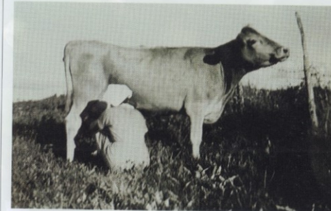
Kaisa Kylänpää lypsillä.