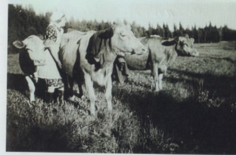
Saara Kylänpää ja lehmät