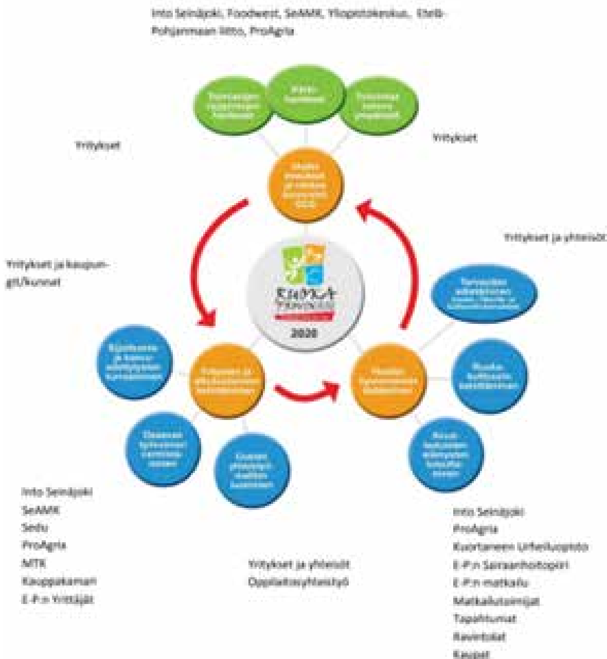
Kuva 2. Ruokaprovinssi-strategia 2020 ja vastuutahot (Ruokaprovinssin vakiinnuttamishanke, [viitattu 1.6.2022]).

Hankkeessa toteutettiin myös Epasteria-baari sekä ideoitiin Ruokaprovinssi Premium-tunnustuspalkinto omalla toiminnallaan Ruokaprovinssin tavoitteita toteuttaneille ja edistäneille yrityksille. Palkinto myönnettiin yrityksille vuosina 2013 ja 2015. Hankkeen toimenpiteenä ideoitiin myös Ruokaprovinssi kaupoissa-kampanja. (Ruokaprovinssin vakiinnuttamishanke 2015.)