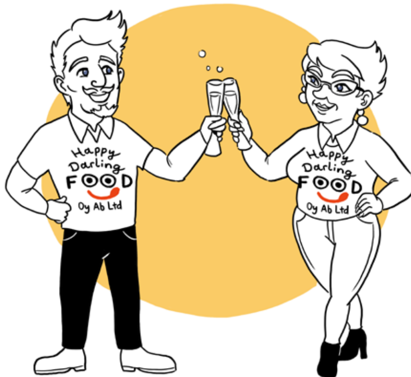
Taulukko 26. Ruokabisnes-painopisteen tavoitteet ja toimenpiteet osa 5/6.