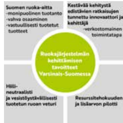
Kuva 5. Varsinais-Suomen ruokajärjestelmän kehittämisen tavoitteet (Food Tech Platform Finland 2020, [viitattu 9.4.2021]).

Varsinais-Suomen ruokaketjun kehittämistyötä tehdään Varsinais-Suomen ruokaketju-seutukunnallisen yhteistyön kautta. (VS-lähiruoka.fi.) Varsinais-Suomen ruokaketjun kehittämisstrategia Elinvoimainen ruokaketju – Made in Varsinais-Suomi – Ruokaketjun painopistealueet 2014–2020 on julkaistu 2014. Tuolloin tavoitteena oli ruokaketjuyritysten toimintaedellytysten parantaminen, ruoka terveyden ja hyvinvoinnin edistäjänä, ruokakulttuurin vahvistaminen sekä vastuullinen ruoantuotanto. Ohjelmakauden painopistealueita olivat vihannes-, puutarhamarja- ja hedelmäntuotanto, juomat ja vesi sekä proteiinit. (Erälinna, Mattila & Mattinen 2014.)