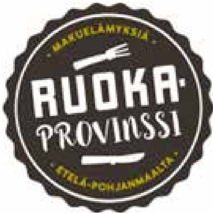
Kuva 3. Ruokaprovinssi-logo 2016–2019 (Kasvua Ruokaprovinsista, [viitattu 7.4.2021]).

Hanke levitti alueella tietoa kansallisesta Osta tilalta-päivästä sekä kehitti yhteistyössä ravintoloiden kanssa Ruokaprovinsin Burgerin sekä Makumatka Ruokaprovinssiin-ravintolakortin hyödyntämään paikallisesti ideoituja Epas-annoksia. Lähiruoan käyttöä ja Ruokaprovinsin kansallista tunnettuutta edistettiin useiden eri valtakunnallisten messujen yhteyteen toteutetuilla Ruokaprovinssi-yhteisosastoilla ja lähiruokatempauksilla sekä Ruokaprovinssi-kartan suunnittelulla ja toteutuksella nostamaan esiin lähiruokaan liittyviä käyntikohteita. Lisäksi hankkeessa uudistettiin Ruokaprovinsin visuaalista ilmettä sekä logo vastaamaan toiminnan nykytilaa (Kuva 2.), päivitettiin verkkosivut ja aloitettiin someviestintä eri kanavissa. (Kasvua Ruokaprovinsista 2017.)