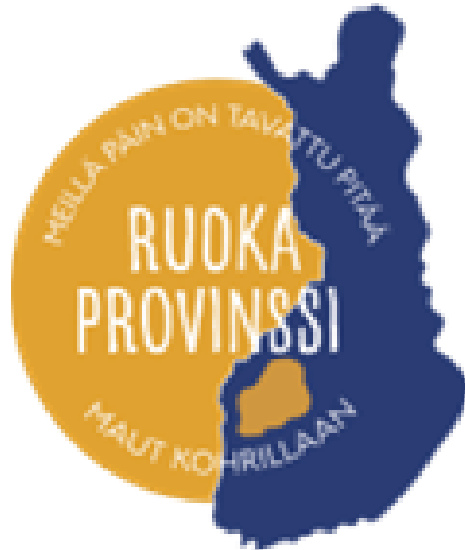
Kuva 4. Ruokaprovinssi-merkki 2019 (Ruokaprovinssi-merkki, [viitattu 9.3.2021]).