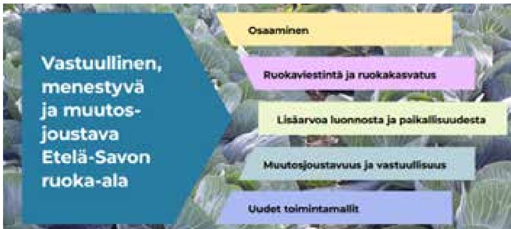
Kuva 6. Etelä-Savon ruoka-alan kehittämishojelman toimenpiteet vuosina 2021–2027, [Harmoinen, Kivijärvi & Särkkä-Tirkkonen, [viitattu 9.4.2021]].

Etelä-Savon (Mikkeli seutukuntineen) ruoka-alan kehittämisen visiona on ”Vastuullinen, menestyvä ja muutosjoustava Etelä-Savon ruoka-ala” (Harmoinen, Kivijärvi & Särkkä-Tirkkonen 2021). Ruoka-alan kehittämisen toimenpiteitä ovat mm. osaamisen lisääminen, ruokaviestintä ja ruokakasvatus, lisäarvoa luonnosta ja paikallisuudesta, muutosjoustavuus ja vastuullisuus sekä uudet toimintamallit.