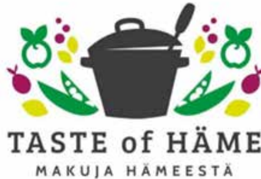
Kuva 11. Taste of Häme - Makuja Hämeestä (Kasvua Hämeessä, [viitattu 24.5.2021]).

Hämeen maakunnan ruoka-alan kehittäminen keskittyy Taste of Häme-brändin alle, joka yhdistää koko ruoka-alan toimijat. Maakunnassa ei ole voimassa olevaa ruoka-alan kehittämisstrategiaa. Alan kehittämistyötä koordinoidaan Kanta- ja Päijät-Hämeen Ruokaviestihankkeen kautta, jota vetää MTK Häme ry. Hankkeen tehtävänä on edistää Kanta- ja Päijät-Hämeen ruokasektorin tunnettuutta, kehitystä sekä yhteistä tekemistä monipuolisen tiedotuksen sekä erilaisien tilaisuuksien ja tapahtumien kautta. (Kasvua Hämeessä.)