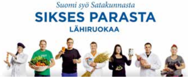
Kuva 10. Sikses parasta lähiruokaa. (Siksesparasta.fi, [viitattu 1.6.2021]).

Vuonna 2014 Pyhäjärvi-instituutti on koonnut Satakunnan elintarvikestrategian vuosille 2014–2020. Strategian teemoina ovat Satakunnan ruokaketju kasvaa Suomen suurimmaksi sekä Satakunta tuottaa vastuullisesti parasta ruokaa. (Satakunnan elintarvikestrategia 2014–2020.) Ruoka-alan kehittämistyötä Satakunnassa on tehty pitkään maaseuturahaston rahoittamilla ”Sikses parasta”-teemaisilla lähiruokahankkeilla. (Siksesparasta.fi.)