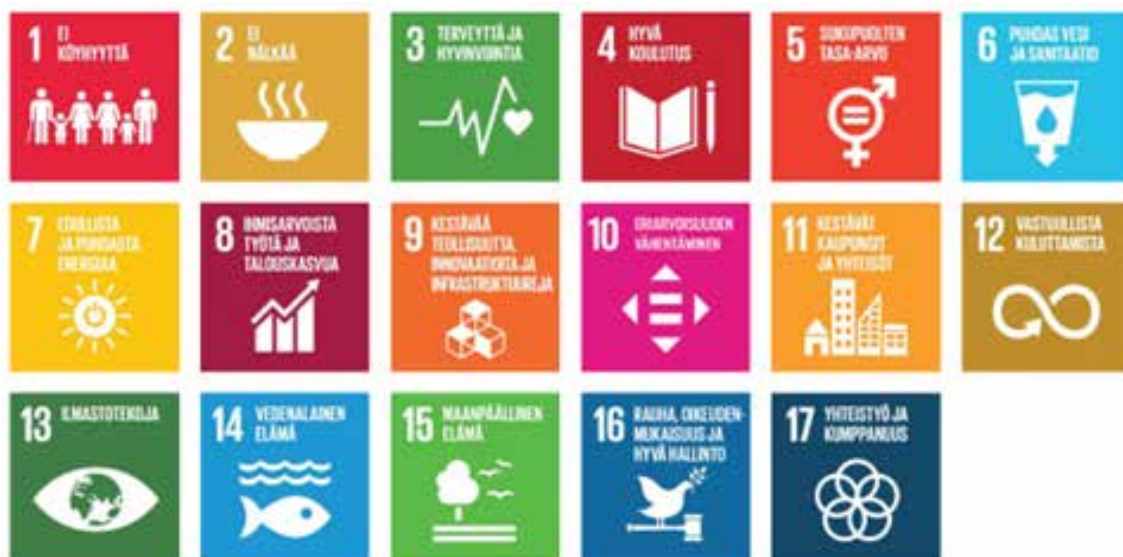
Kuva 1. Yhdistyneiden kansankuntien kestävä kehityksen tavoitteet. (Suomen YK-liitto, [viitattu 28.12.2022]).

Strategian laadinnan aikana vuosina 2021-2022 on eletty jatkuvien myllerrysten maailmassa. Vihdoin on maailman laajuisesti herätty toden teolla, vaikkakin eripuraisesti ja hitaasti, torjumaan ilmastonmuutoksen ja luontokadon uhkia. Ympäristöuhat ovat myös globaalin ruokajärjestelmän uhkia. Maailman ruokajärjestelmän on muututtava, jotta se pystyy vastaamaan kestävästi ja joustavasti ympäristöhaasteisiin sekä maapallon kasvavan väestön lisääntyvään ruoan tarpeeseen.