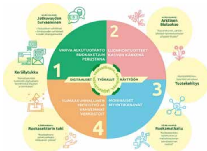
Kuva 9. Maistuvampi Kainuu Ruokastrategia painopisteet ja kärkihankkeet (Hypén 2020, [viitattu 9.4.2021]).

Kainuun ruokastrategia ”Maistuvampi Kainuu Ruokastrategia 2020–2025” on julkaistu vuonna 2020. Strategian neljäksi painopisteeksi on valittu alkutuotanto, luonnontuotteet, moninaiset myyntikanavat ja ylimaakunnallinen yhteistyö verkostoineen sekä näitä edistävät neljä kärkihanketta. (Hypén 2020.)