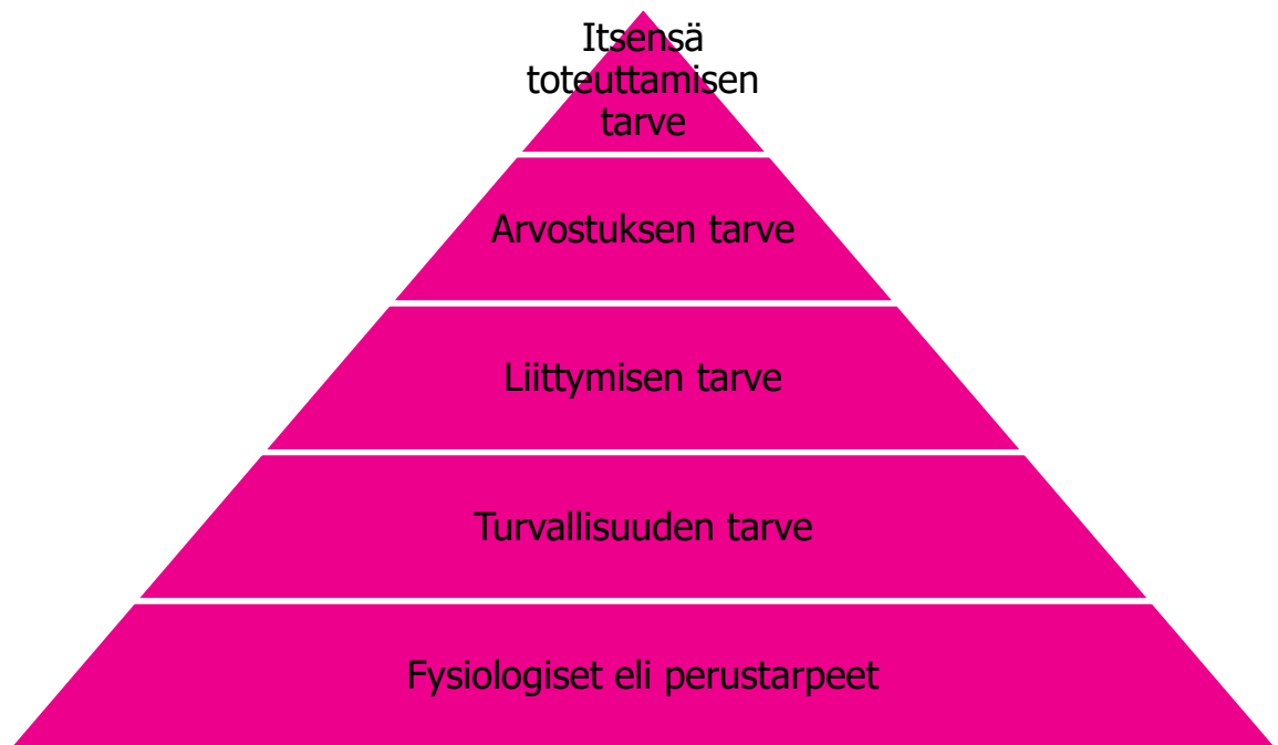
Kuvio 1. Maslowin tarvehierarkia (Myöhänen ja Repo 2022).

Yleensä organisaatio näkee paljon vaivaa henkilöstön sitouttamiseksi. Organisaation strategian, vision ja arvojen kautta on pyrkimys saada henkilöstö sitoutumaan työhönsä. Tärkeää olisikin, että henkilöstö itse pääsee laatimaan ja olemaan mukana strategian ja arvojen suunnitteluprosessissa. Mikäli organisaatio ei kuule henkilöstöään strategian ja sen tavoitteiden laatimisessa, voi oman työn tavoitteet ja työnsisältö jäädä epäselväksi ja sitä kautta potentiaalisesti huonontavat henkilöstön motivaatiota, sitoutumista ja työhyvinvointia. Itsensä arvostetuksi ja kuulluksi tunteva työntekijä on todennäköisesti myös sitoutunut työhönsä. (Juuti 2015 121, 123, 127; Lemmetty, Keronen, Auvinen & Collin 2021, 102–103.)