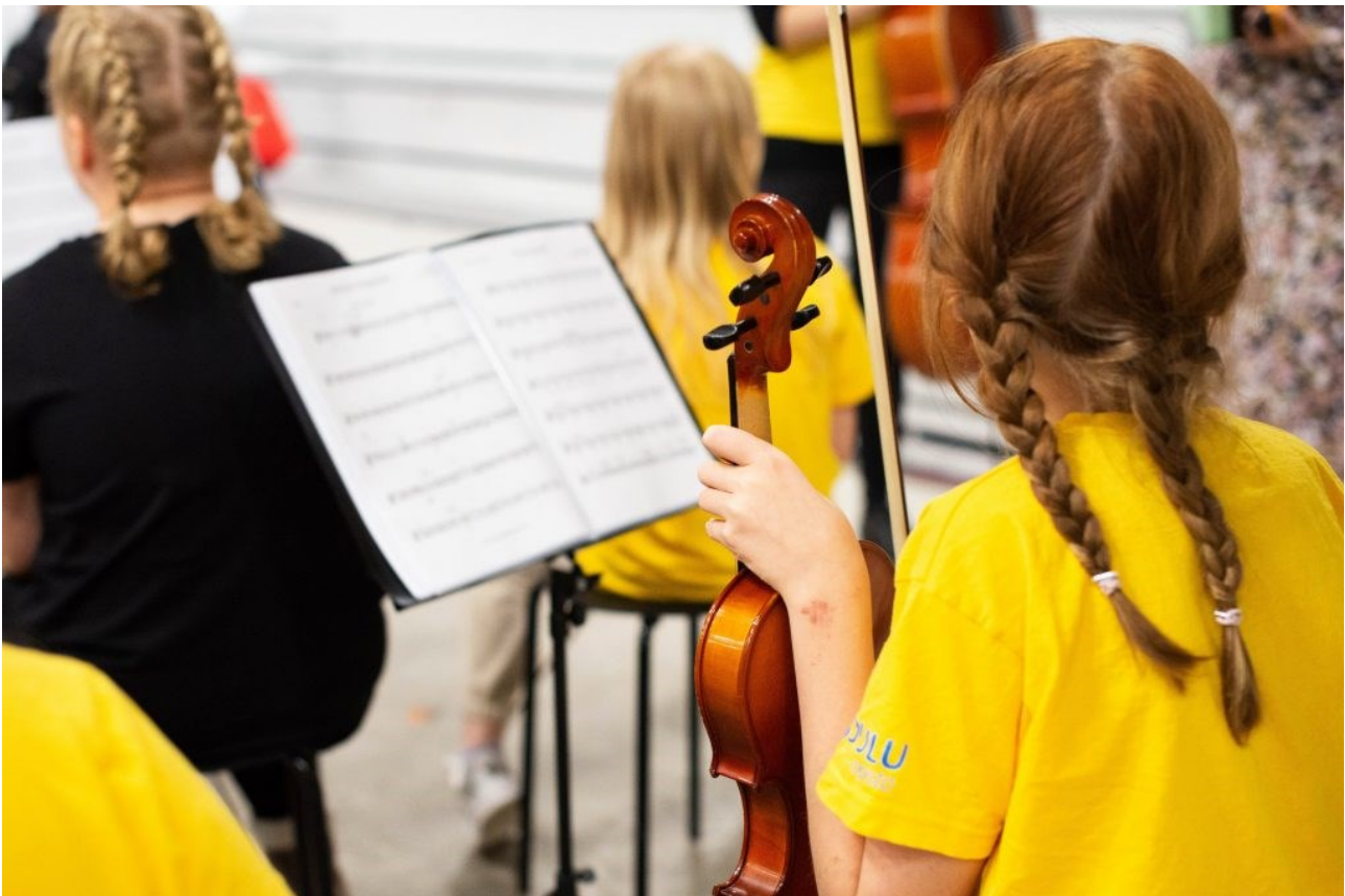
Tempo-orkesterin soittajat valmistautuvat esiintymiseen.

Toimintaan osallistumalla opiskelijat edistävät myös opintojaan kerryttämällä opintopisteitä esimerkiksi projektiharjoitteluun tai vapaasti valittaviin opintoihin. Yhteistyö on saatu ensimmäisen puolen vuoden aikana hyvälle alulle, ja se toivottavasti vain vahvistuu tulevaisuudessa.