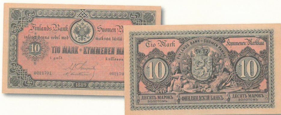
Kuva 9. 10 markkaa 1889, etu- ja taustapuolet. Laskettu liikkeelle loppuvuodesta 1890. Setelin arvo kuvan kaltaisessa huippukunnossa noin 1 000 euroa.