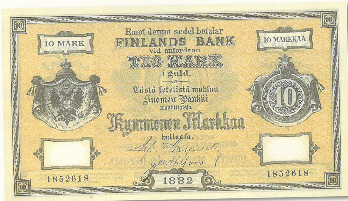
Kuva 5. Aito 10 markan seteli vuodelta 1882.

Vuoden 1882 mallin 10 markan seteli jouduttiin laskemaan liikkeelle pelkästään sen vuoksi, että mallin 1878 10-markkan setelistä ilmaantui markkinoille niin hyvä väärennös, että katsottiin parhaaksi vetää kaikki vanhan mallin punaiset mallien 1875 ja 1878 10 markan setelit pois kierrosta ja korvata ne uudella keltaisella