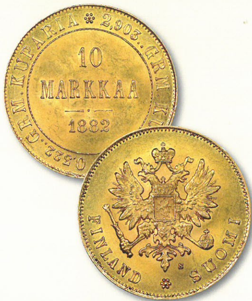
Kuva 7. 10 markan kultaraha vuodelta 1882. Aiemmin epäkäytännöllisinä pidetyt ja siksi heikosti kiertäneet 10 markan kultarahat saivat väärennösten takia suurta suosiota.

Väärää rahaa liikkui pian koko maassa, ja arvailu niiden alkuperästä kiihtyi: