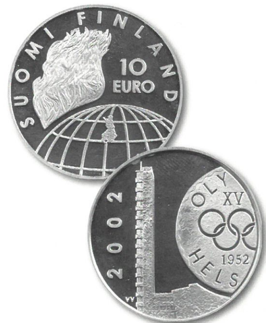
Kuva 12. Helsingin olympialaisten 50-vuotismuistoraha 10 € 2002, proof-lyönti. Tästä juhlarahasta, jonka halkaisija on 38,6 mm, paino 27,4 grammaa ja koostumus Ag 925 o/oo Cu 75 o/oo, ei tullut mitään harvinaisuutta, vaan sitä on myyty viime vuosina vain hieman nimellisarvoa korkeammilla hinnoilla.

Poiketen alkuperäisien olympialaisten kisojen perinteestä sodat eivät keskeytyneen modernien olympialaisten ajaksi. Ensimmäinen maailmansota aiheutti vuoden 1916 Berliinin olympiakisojen peruuttamisen. Vuoden 1940 olympiakisat piti alun perin pitää Tokiossa, mutta Japanin ja Kiinan välisen vuonna 1937 puhjennun sodan takia Japani luopui vuonna 1938 niiden järjestämisestä ja pitopaikaksi valittiin Helsinki. Toisen maailmansodan sytyttyä oli myös Helsingin olympialaiset peruutettava.