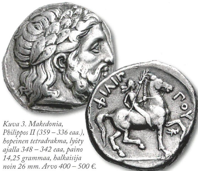
Kuva 3. Makedonia, Philippos II (359 – 336 eaa.), hopeinen tetradrakma, lyöty ajalla 348 – 342 eaa, paino 14,25 grammaa, halkaisija noin 26 mm. Arvo 400 – 500 €.

Varsinaisen rahanlyönnin katsotaan alkaneen noin vuonna 600 Lydyiassa, nykyisen Turkin alueella. Ensimmäiset olympiakisoja kunnioittavat rahat lyötiin noin vuonna 480 eaa. ja niiden tarkoitus oli osoittaa rahan lyötättäneen hallitsijan menestystä olympialaisissa. Hevoskilpailut olivat antiikin olympialaisten arvostetuimpia lajeja. Hevoset olivat sosioekonomisia statussymboleita koskapa vain