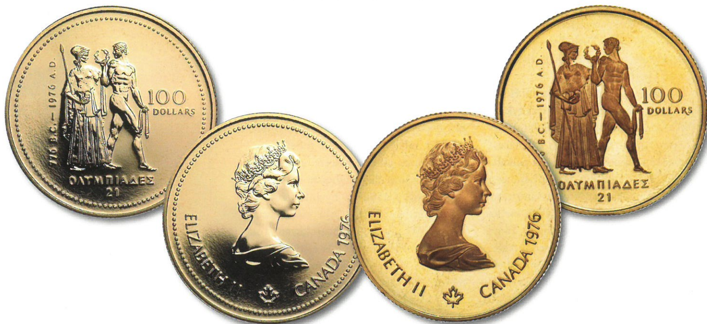
Kuva 14. Kanadan 100 dollarin kultaiset olympiarahat vuodelta 1976. Vasemman BU-version paino on 13,34 g, halkaisija on 27,0 mm, kultapitoisuus on 583,3 o/oo ja painosmäärä on 650 000 kappaletta. Arvo kullan arvo eli reilut 400 euroa. Oikean PROOF-version paino on 16,97 g, halkaisija on 25,0 mm, kultapitoisuus on 916,7 o/oo ja painosmäärä on 337 342 kappaletta. Arvo kullan arvo eli vajaat 900 euroa.

Kun olympialaiset kesäkiisat viimein saatiin järjestettäväksi Helsingissä 19. heinäkuuta – 3. elokuuta vuonna 1952, oli se sodista toipuvalle Suomelle merkittävä kansallisen itsetunnon ja näytön paikka.