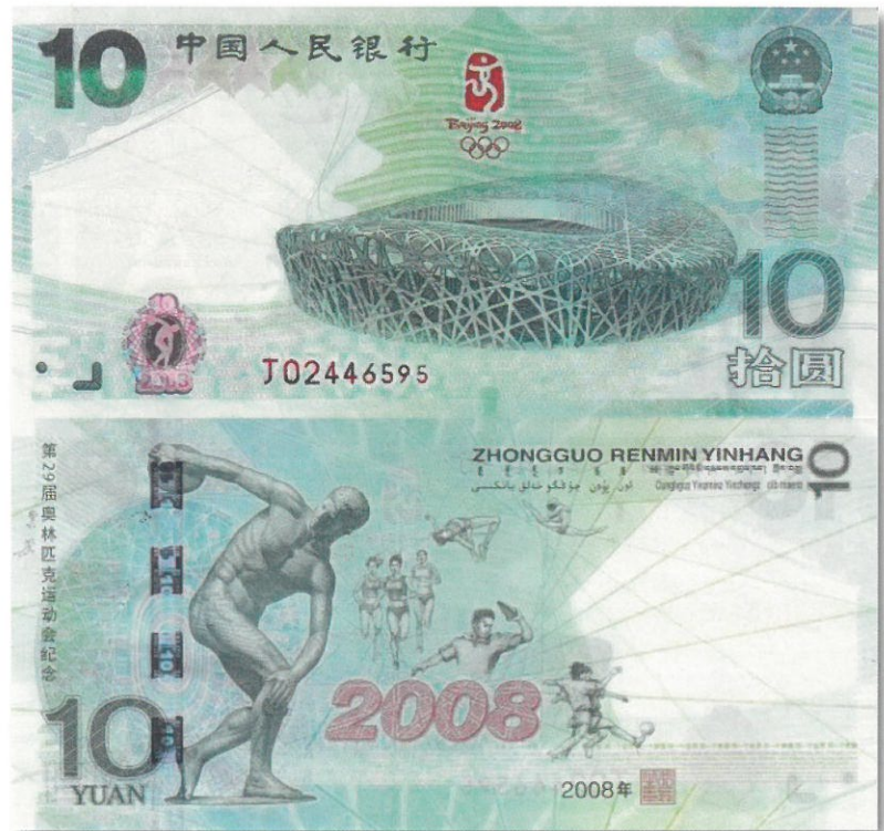
Kuva 19. Kiinan Pekingin olympiakisojen 2008 kunniaksi liikkeelle laskema 10 rénmínbì yuanin seteli vuodelta 2008. Setelin koko on 148,5 mm * 72 mm, eli se on hieman normaalia käyttökymppiä (140 mm * 70 mm) hieman suurikokoisempi. Setelin nykyinen arvo on noin 800 euroa.

sisältäen huutokauppakomission. Rahan lopullinen ostohinta oli tuolloin täs- mälleen rahan sisältämän kullan arvo. Ja kuinka ollakaan, nykyisin (tätä artikkelia kirjoitettaessa yli 11 vuotta myöhemmin eli elokuun loppupuolella 2022) on rahan kulta-arvo USD 569 000 eli käytännös- sä sama, kuin vuoden 2011 alun myynti- noteeraus – toki ilman dollarin ostovoim- an muutosten huomiointia.