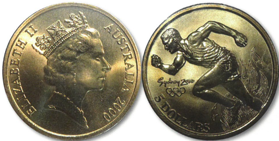
Kuva 16. Australian 5 dollarin alumiinipronssinen olympiaraha vuodelta 2000. Paino 20 g, halkaisija 38,74 mm ja painosmäärä tämän rahan osalta oli 230 209 kappaletta. 5 dollarin alumiinipronssirahoja tehtiin kaikkiaan 28 erilaisen rahan sarja. Rahan arvo nykyään on noin 5 euroa.

Libanonin väärennökset tehtiin käyttäen mallina aitoa rahaa, joten se on arvoja tunnusuoleltaan miltei täydellinen kopio alkuperäisestä. Väärenneiden ainoa varsinainen valmistusvirhe on reunakuviin vääriin päin kaiverretut kalevala-kädet. Selitys tälle hölmölle virheelle lienee se, että rahojen valmistajana toiminut mitali valmistaja kaiversi kalevala-kädet käsin, ja