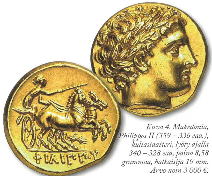
Kuva 4. Makedonia, Philippos II (359 – 336 eaa.), kultastaatteri, lyöty ajalla 340 – 328 eaa, paino 8,58 grammaa, halkaisija 19 mm. Arvo noin 3 000 €.