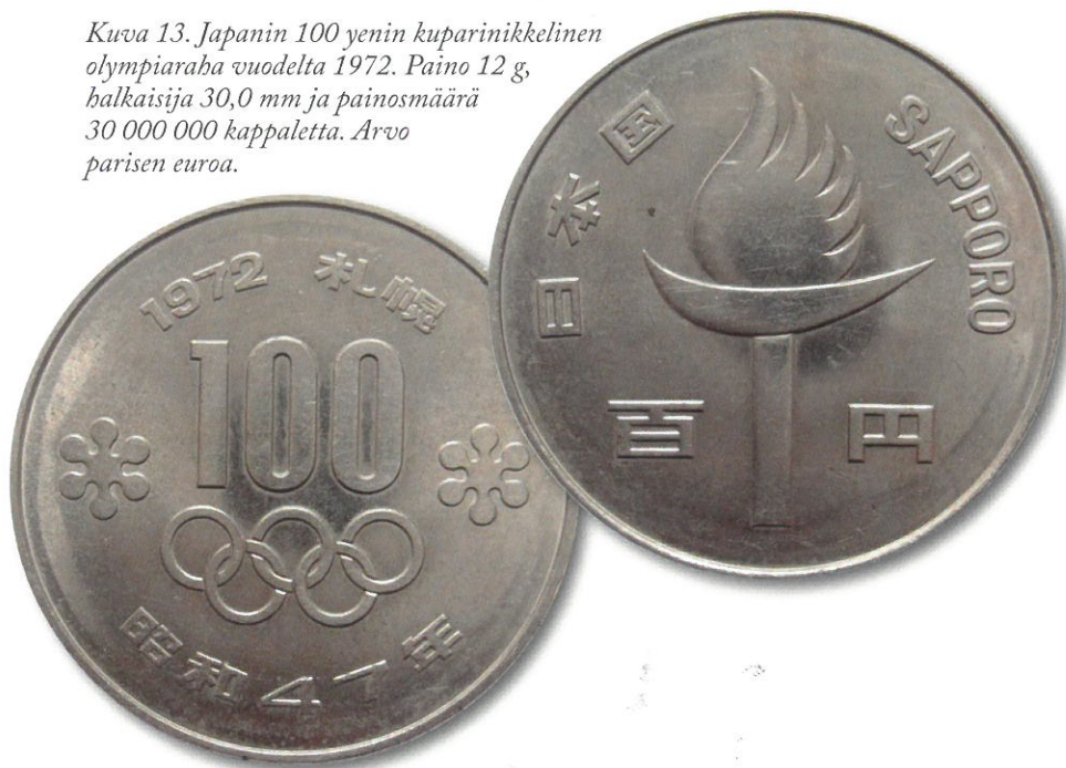
Kuva 13. Japanin 100 yenin kuparinikkelinen olympiaraha vuodelta 1972. Paino 12 g, halkaisija 30,0 mm ja painosmäärä 30 000 000 kappaletta. Arvo parisen euroa.

Myös vuoden 1944 Lontoon olympiakisat peruttiin toisen maailmansodan takia. Vuoden 1940 talviolympialaiset siirrettiin Sapporosta (Japani) vuonna 1938 St. Moritziin (Sveitsi) ja sieltä sveitsiläisten järjestelykomitean riitaisuuden takia keväällä 1939 Garmisch-Partenkircheniin (Saksa) ja lopulta nekin peruttiin, kuten myös suunnitellut vuoden 1944 talviolympialaiset Cortina d'Ampezzo:ssa, Italiassa toisen maailmansodan takia.