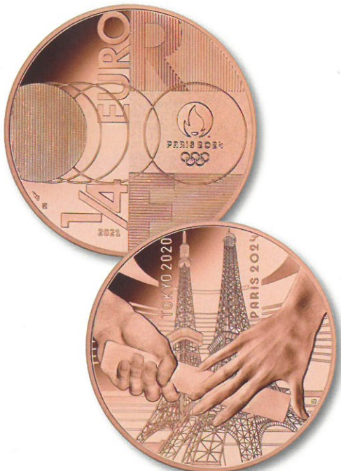
Kuva 20. Ranskan 1/4 euron kuparinen olympiaraha vuodelta 2021. Paino 17 g, halkaisija 34,0 mm ja painosmäärä 1 000 000 kappaletta. Rahan emissio- hinta Ranskassa on 6 euroa.

Kiinan massiivista 10 kilon olyn- piakultarahaa markkinoitiin ja myytiin vuonna 2008 esimerkiksi Yhdysvaltojen keräilymarkkinoilla napakkaan 1 000 000 US dollarin hintaan. Niitä myös myytiin ainakin yksi, koskapa tammikuun 2. päi- vänä vuonna 2011 myytiin juuri tällainen raha (numero 21) Heritage New York Signature Sale -huutokaupassa kohde- numerolla #23653 hintaan USD 575 000