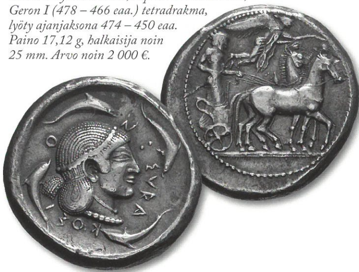
Kuva 1. Syracuse/Gela, hopeinen tetradrakma, Geron I (478 – 466 eaa.) tetradrakma, lyöty ajanjaksona 474 – 450 eaa. Paino 17,12 g, halkaisija noin 25 mm. Arvo noin 2 000 €.