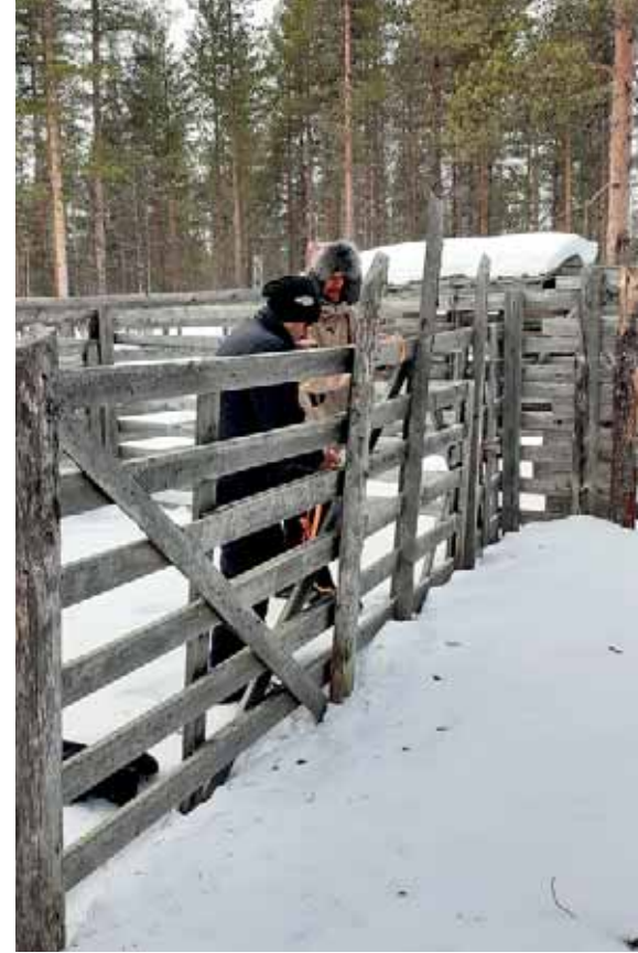
Sattasvaaran erotusaidalla tehtiin käytännön harjoituksia.

Suunnittelemme parhaillaan seuraavia työnjohtajien päiviä ensi vuoden puolelle. Tulevassa koulutuksessa pyrimme huomioimaan viime koulutuksesta saamamme kehitysehdotukset ja otamme huomioon keväällä valmistuneen YAMK opinnäytetyön Poronhoitotöiden johtamisen merkitys työhyvinvoinnille -tulokset.