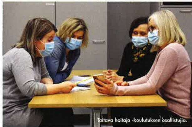
Taitava hoitaja -koulutuksen osallistujia.

Tulevaisuuden hoitotyöntekijöiden osaaminen sisältää sekä ammattialakohtaista osaamista että asiakaslähtöisyys- ja työntekijäosaamista (1). Lisäksi työelämä edellyttää niin tutkimus- ja kehittämisosaamista kuin lainsäädännön ja etiikan