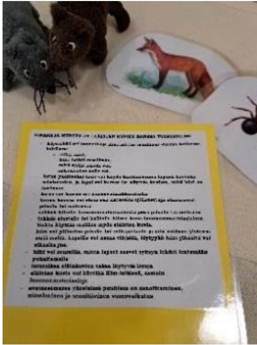
Kuva 4. Hiiret, eläinkuvat ja käyttövinkit

Materiaalipaketin toteutuksessa käytettiin jo olemassa olevia materiaaleja, joten sen toteuttamisesta ei syntynyt erillisiä kuluja. Materiaalipakettiin kuuluvat kortit ja laulujen sanat sekä käyttövinkit laminoitiin, jotta ne kestäisivät paremmin erilaisia sääolosuhteita ulkona. Materiaalipakettiin kuuluu myös valkoinen kankainen alusta, jolle voidaan esimerkiksi metsässä kerätä erilaista luonnonmateriaalia kasvattajan ohjeistuksen mukaan. Kasvattaja voi ohjeistaa lapsia etsimään esimerkiksi pehmoleluhiirille sopivaa ravintoa luonnosta tai tekemään hiirille pesän. Näiden toimintojen avulla lisätään lasten välistä vuorovaikutusta sekä lasten ja kasvattajien välistä vuorovaikutusta. Kasvattajan rooli on merkityksellinen toiminnan sanoittamisessa ja aloitteisiin vastaamisessa. Materiaalipaketin ohjeistuksessa painotettiin kasvattajan roolin merkitystä,