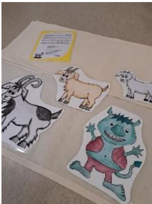
Kuva 2. Kolme pukkia ja peikko

Yksi Kolmen pukin käyttövinkeistä kehottaa pohtimaan yhdessä lasten kanssa, miten ulos saadaan rakennettua sopivat kulissit näytelmälle (kuva 3). Valmiiksi vinkiksi annetaan, että laulussa esiintyvänä siltana voisi toimia kepit ja joen voisi tehdä yhdessä pienistä kivistä. Vinkeissä ohjeistetaan myös, että näytelmän ja laulun voi toteuttaa eri paikoissa ja eri tavoilla. Laulua voidaan laulaa eri tavoilla, esimerkiksi liikuntaleikkinä tai niin, että lapset voivat itse esiintyä peikkona ja pukkeina.