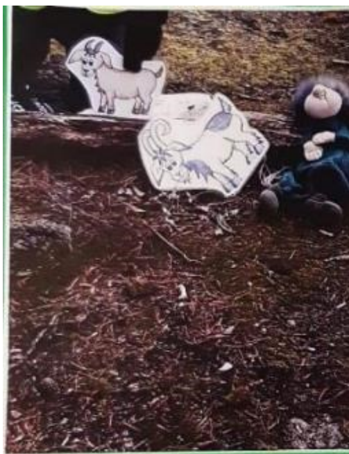
Kuva 5. Esitys metsässä

Kolme pukkia koettiin ihanaksi jutuksi metsässä käytettynä, ja sitä olikin käytetty sekä esityksenä että näytelmänä (kuva 5). Myös lapset olivat saaneet itse esittää näytelmää laminoidun materiaalin kanssa, ja toimintaa oli jatkettu vielä päiväkodilla laulun ja sadun muodossa. Lorukorteista koettiin kivoiksi sekä kuvat että niiden takana olevat lorut. Kaikki materiaali koettiin siistiksi ja huolitelluiksi, ja koettiin, että myös lapset pitivät niistä. Toimintavinkkejä pidettiin toteutettavissa olevina. Hyvänä pidettiin myös sitä, että materiaalipaketti oli helposti muokattavissa esimerkiksi lasten mielenkiinnon mukaan tai vuodenaikojen tai muiden kalenteritapahtumien mukaan. Kasvattajat kokivat, että tuttujen laulujen kanssa oli helppoa lähteä työskentelemään, koska uusien laulujen opetteluun ei arjessa ole aikaa. Varhaiskasvatussuunnitelma korostaa eri oppimisen alueiden huomioon ottamisen merkitystä varhaiskasvatuksen toiminnassa (Opetushallitus 2022, 42–51), ja opinnäytetyömme materiaalipaketti oli mahdollistanut eri oppimisen alueiden toteuttamisen. Lasten kanssa oli esimerkiksi laskettu eläinten jalkoja ja tutkittu värejä.