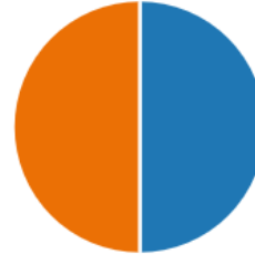
Kuvio 2. Kuinka paljon sain tietoa ennen koulutusta?

Saavutettavuuden näkökulmasta tämä kysymys oli oleellinen. Vastaajat saivat mielestään erittäin hyvin tietoa ennen koulutusta, koska kaikki vastasivat joko saaneensa kaiken informaation tai suurimman osan tarvitsemastaan informaatiosta. Osallistujat saivat ennen koulutusta monipuolisen informaatiopakettin sähköpostitse ja lisäksi heille kerrottiin ennakoivasti koulutuksen sisällöistä ja menetelmistä koulutustapahtuman alussa. Tähän monikanavaiseen tiedonsaannin merkitykseen saavutettavuuden näkökulmasta viitataan myös luvussa 4.2 (Vates 2022).