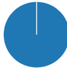
Kuvio 3. Turvallisemman tilan periaatteiden toteutuminen.

Kaikki kyselyyn vastanneet olivat yksimielisesti sitä mieltä, että koulutuksessa toteutuivat turvallisemman tilan periaatteet. Tämä oli tärkeä tulos yhdenvertaisen koulutustapahtuman tavoitteiden toteutumisen kannalta.