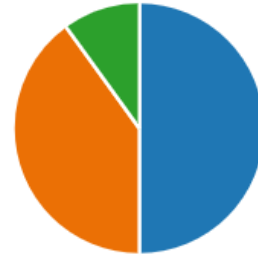
Kuvio 4. Osallisuuden ja saavutettavuuden toteutuminen

Viiden vastaajan mielestä saavutettavuus ja osallisuus toteutuivat täysin ja neljän vastanneen mielestä suurimmaksi osaksi. Yhden vastaajan mielestä saavutettavuuden toteutumiseen tarvittaisiin vielä parannuksia.