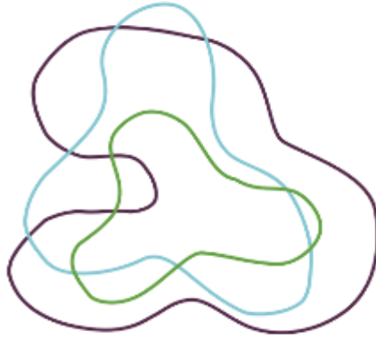
Kuva 1. Osallisuuden osa-alueet. Sisin, vihreä kehä: Osallisuus omassa elämässä. Keskimäinen, sininen kehä: Vaikuttaminen ja vaikuttuminen. Uloin, violetti kehä: Paikallinen osallisuus (Isola ym. 2017b, 24)

Isolan ym. (2017a, 24) mukaan osallisuus on hahmotettavissa ääriviivoiltaan aaltoilevina, sisäkkäisinä kehinä. Osallisuutta omassa elämässä vahvistetaan kohtuullisen toimeentulon, tarvittavien palveluiden avulla sekä mahdollistamalla tilaisuuksia toimintaan, jolla luodaan yhteyksiä toisiin ihmisiin. Yksilön autonomian ja elämän ennakoitavuuden vahvistaminen, elämän hallittavuuden edistäminen ja toimintaympäristön ymmärrettävyyden lisääminen vahvistavat osallisuutta.