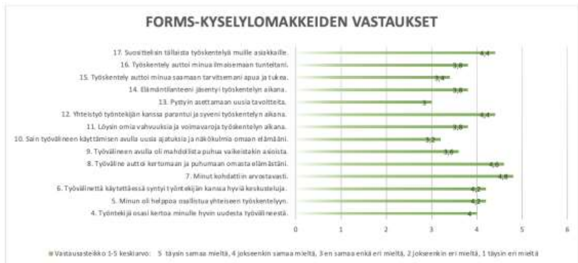
Kuvio 5. FORMS-kyselylomakkeiden täyttäneiden asiakkaiden vastausten keskiarvo koskien kokeiltujen työvälineiden käyttöä.