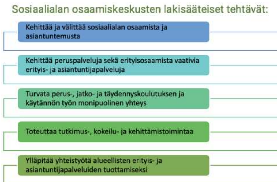
Kuvio 1. Sosiaalialan osaamiskeskusten lakisääteiset tehtävät (Pääkaupunkiseudun sosiaalialan osaamiskeskus, i.a.-a).

Soccan perustehtäviin kuuluu laaja-alainen kehittämistyö, koskien sosiaalihuoltoon kuuluvaa sisältöä. Socca on intensiivisesti mukana Sote-uudistuksen valmistelussa ja sosiaali- ja terveystalouden yhdistymistä koskevassa kehittämisessä. Osaamiskeskuksen toiminta on sosiaalialan osaamiskeskusta koskevan lain ja asetusten määrittelemää (Kuvio 1.), sekä pääkaupunkiseudulla solmitun yhteistyösopimuksen mukaista. (Pääkaupunkiseudun sosiaalialan osaamiskeskus, i.a.-a.)