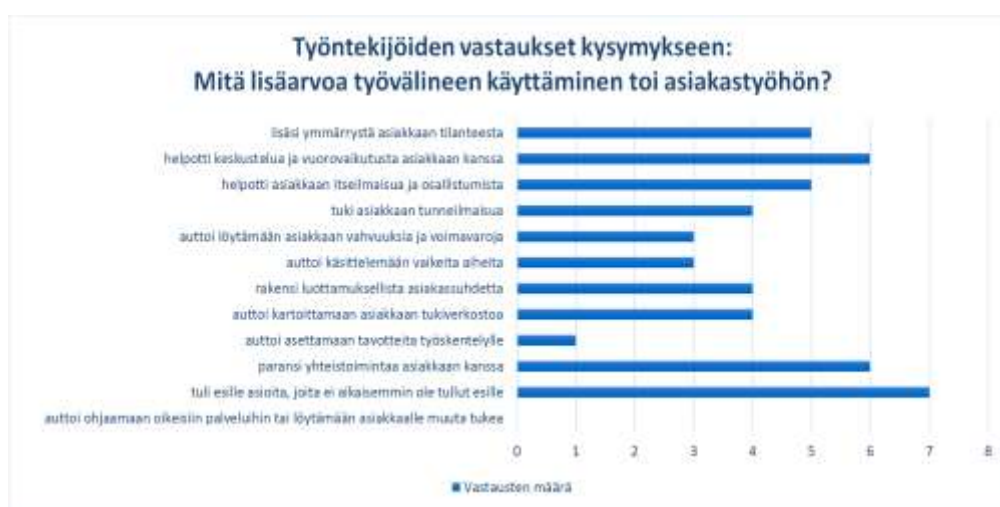
Kuvio 4. FORMS-kyselylomakkeiden täyttäneiden työntekijöiden vastaukset koskien työvälineiden käytön työhön tuomaa lisäarvoa.

käytön lisäävän ymmärrystä asiakkaan tilanteesta ja helpottavan asiakkaiden itseilmaisua sekä osallistumista. Noin puolet vastanneista näki työvälineiden käytön tukevan asiakkaan tunneilmaisua, rakentavan luottamuksellista asiakassuhdetta ja auttavan asiakasta tukiverkoston kartoittamisessa. Työvälineiden huomattiin jossain määrin auttavan asiakkaita löytämään omia vahvuuksiaan ja voimavarojaan sekä käsittelemään itselleen vaikeita aiheita työskentelyn aikana. Vastanneiden mielestä työvälineiden hyöty työskentelyn tavoitteiden asettamiseksi oli vähäinen eikä apua asiakkaalle muun tuen tai oikeanlaisen palvelun piiriin ohjaamisessa koettu. (Kuvio 4.)