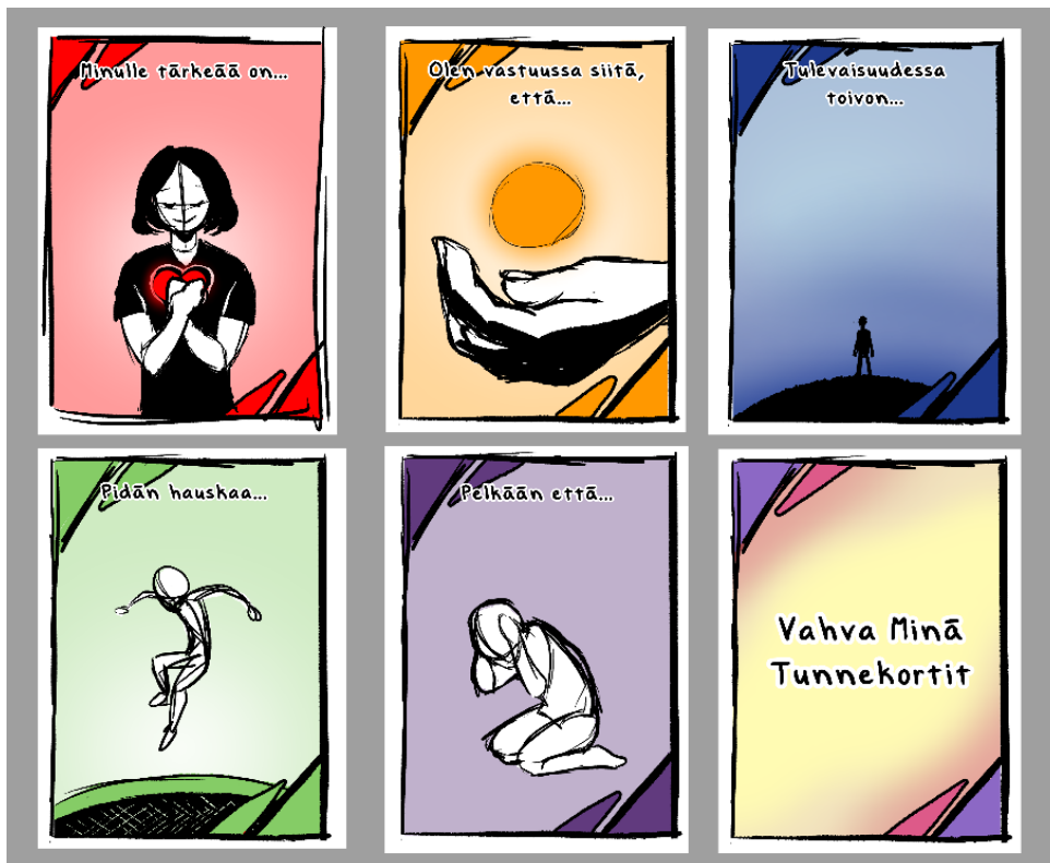
Kuvio 2. Ensimmäiset nopeat kortti tyyli testit sekä ensimmäinen kortti selkäpuoli idea

Aluksi tein viidestä eri kortista pienet ja nopeat digitaaliset luonnokset, joilla testattiin korttien tekotyyliä ja että kohtaako minun sekä toimeksiantajan ajatukset korttien visuaalisesta ilmeestä (kuvio 2). Mietimme kuvien rosoisuutta ja kuinka tarkkoja niistä tehtäisiin. Tässä vaiheessa tein myös ensimmäisiä ideoita korttien selkäpuolesta.