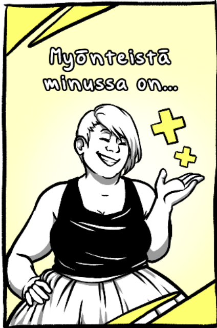
Kuvio 3. Kuvitus "Myönteistä minussa on..." -tunnekorttiin

(kuvio 3). Palasin myös takaisin ensimmäisten korttien pariin testaamaan, että kuinka varjot sopivat niihin, koska en ollut alun perin laittanut varjoja niille.