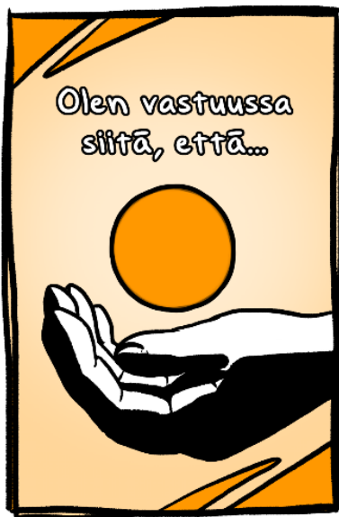
Kuvio 6. Kuvitus "Olen vastuussa siitä, että..." -tunnekortista

Annoin kortteihin hahmoille erilaisia vaate- ja hiustyylejä, jotta ne edustaisivat useampia ihmisiä elämässä. Pääasiassa keskityin kuitenkin nuorten aikuisten vaatetukseen, koska nämä tunnekortit ovat tälle ikäryhmälle tarkoitettuja. Pari poikkeus tapausta on toki, kun kuvissa esiintyy myös lapsi tai vanhempi hahmo.