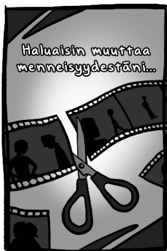
Kuvio 5. Kuvitus ”Haluaisin muuttaa menneisyydestäni...” -tunnekortille

”Haluaisin muuttaa menneisyydestäni...” kortti on täysin mustavalkoinen, kuvastamaan pysähtynyttä aikaa. (kuvio 5). Näille sävyille on kuitenkin joitakin poikkeus tapauksia. Esimerkiksi viimeisenä tehty kortti ”Selviän vaikeista ajoista...” on tumman punaisella, koska kortin aihe voi olla rankempi.