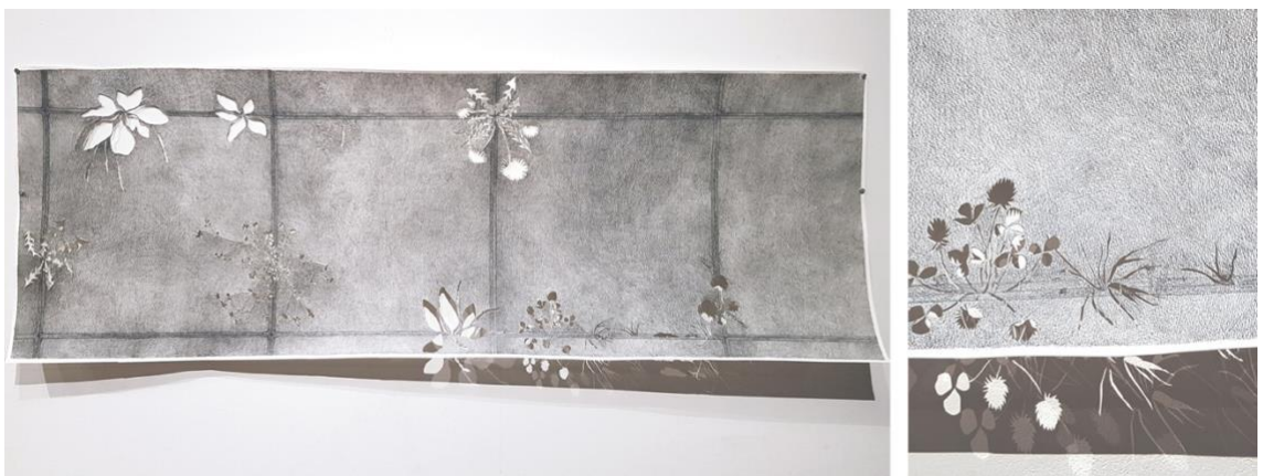
Kuvio 2. Teos Ei mitään rivien väleissä (Elina Katara, 2022, lyijykynä paperille, paperileikkaukset)

Aloin ajatella käsitettä ”rivien välistä lukeminen”, eli sitä, miten jokin asia sanomatta jätettynäkin voidaan kuitenkin tulkita ja ymmärtää, tai jokin asia ikään kuin annetaan ymmärtää, sanomatta sitä kuitenkaan suoraan. Nopeasti tehtyihin työmuistiinpanoihin 17.4.2022 (liite 2) tallensin ajatusten kulkua, joka johti uuden betonilaatta-aiheisen, mutta paperipohjaisen teoksen syntymiseen (kuvio 2). Teos sai alkunsa sanoista. Muistiinpanoissani tartuin ilmaisuun ”ei mitään rivien väleissä” ja tästä ilmaisusta tuli myöhemmin myös teoksen nimi. Valitsin piirustusvälineeksi lyijykynän, koska sana ”lyijy” aiheuttaa mielikuvia raskaudesta ja haitallisuudesta. Lyijykynäjäljen harmaus viittaa myös betonin harmauteen.