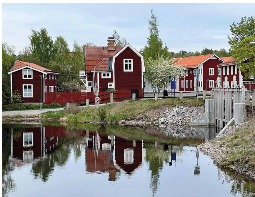
Faluröda stugor.