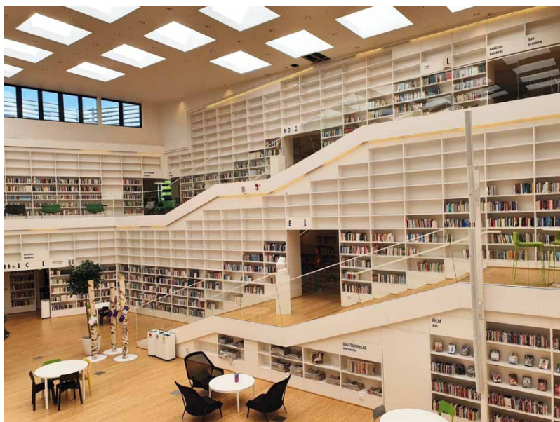
Biblioteket på Högskolan Dalarna.