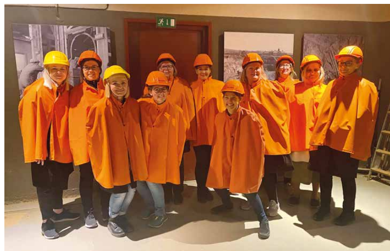
Gruppen som besökte Falu gruva.