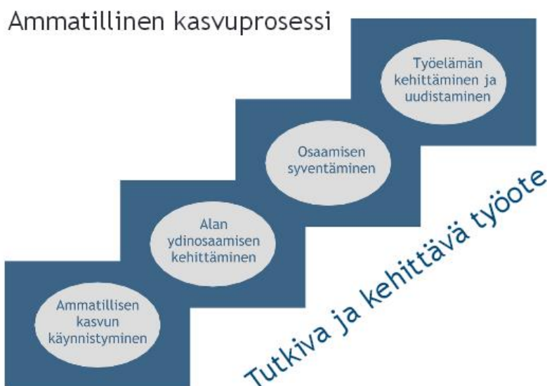
Kuva 2: Ammatillinen kasvuprosessi (Laurea-ammattikorkeakoulu 2007, 13)

12.) Opiskelijan roolin kehittyminen pelkästä toimijasta aktiiviseksi kehittäjäksi nähdään LbD-toimintamallissa neliportaisen ammatillisen kasvuprosessin kautta (Kuva 2.)