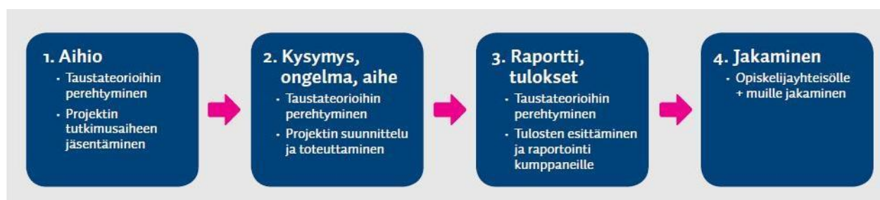
Kuva 4: Projektin kulku (Laurea-ammattikorkeakoulu)

ken. Tiedon jakamisen periaate ei aina noudata tiettyä kaavaa, vaan tapahtuu projektin lomassa tai sen jälkeen opiskelijoiden keskinäisissä keskusteluissa.