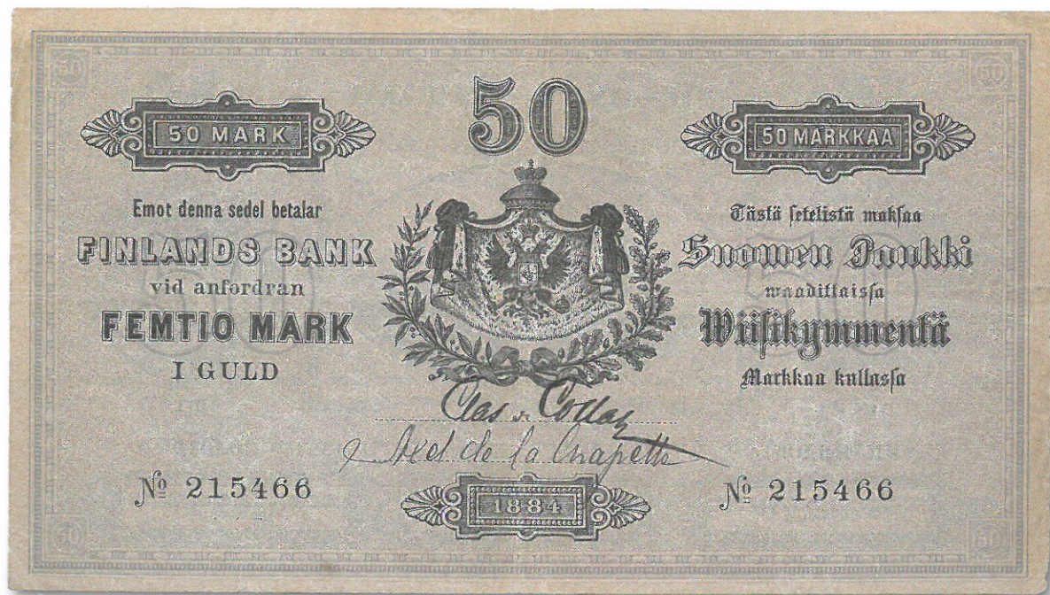
Kuva 3. Aito 50 markkaa 1884, etupuoli.

rän setelin, minkä lisäksi vaihdettiin eilisen aikana erässä liikkeessä samanlainen seteli. Kun asiasta tehtiin ilmoitus, pääsi poliisi heti tuloksellisesti jäljille ja jo samana päivänä pidätettiin vahvasti epäiltynä kolme henkilöä, kaksi miestä ja yksi nainen, kaikki