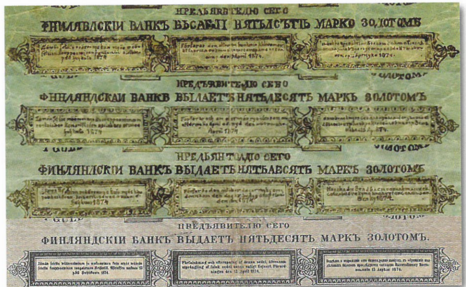
Kuva 6. Kolmen väärennetyn setelin rangaistustekstit (3 ylintä, lähde: Pohjanmaan museon kokoelmat) ja aidon setelin rangaistustekstit (alin, lähde: Michael Wideniuksen kokoelmat). Huomaa väärennosten onneton taso. Varsinkin venäjänkielinen arvomerkitä on ollut teki-jälle ylivoimainen vastus. Ihmetellä vain täytyy, että joku näitäkin tekeleitä oli vastaanot-tanut oikeana rahana. Ilmeisesti valaistusolosuhteet eivät ole olleet kovin hyvät ja ehkä tekeleitä vastaan ottaneiden henkilöiden läbinäkö ei ehkä ollut terävintä sorttia.

Oikeuden pyörät oli siis loppuvuonna 1897 saatu liikkeelle, ja asia sai lopullisen päätöksensä seuraavan vuoden heinäkuussa: