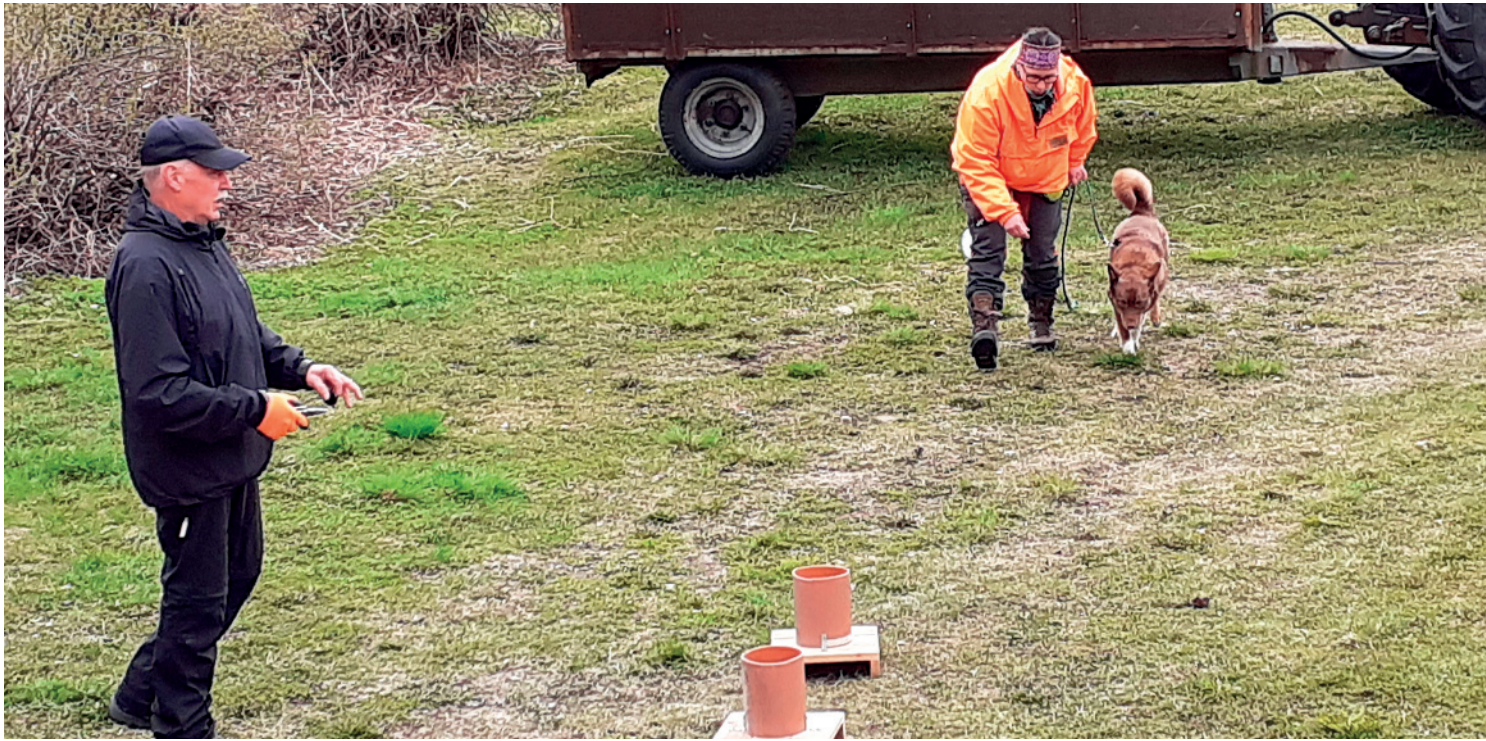
Jääkäri hakee raadon hajua pihalle asetelluista purkeista.

- Toistojen kautta saadaan poronraadon haju koirien mieleen niin, että ne ilmaisevat raadon, vaikka sellainen sattuisi vastaan kesken kalastusreissun.