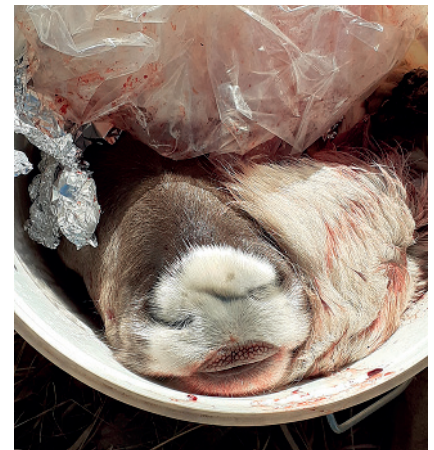
'Raatosankko', johon on koottu poronruhon osia, verta ja sisäelimiä. Sankkoa on pidetty lämpimässä tilassa useita päiviä ja näin on luotu keinotekoinen raato.

- Oli rotu mikä tahansa, niin raatokoiran valinta on hyvä aloittaa pennun hankinnasta. Vilkas, rohkea ja