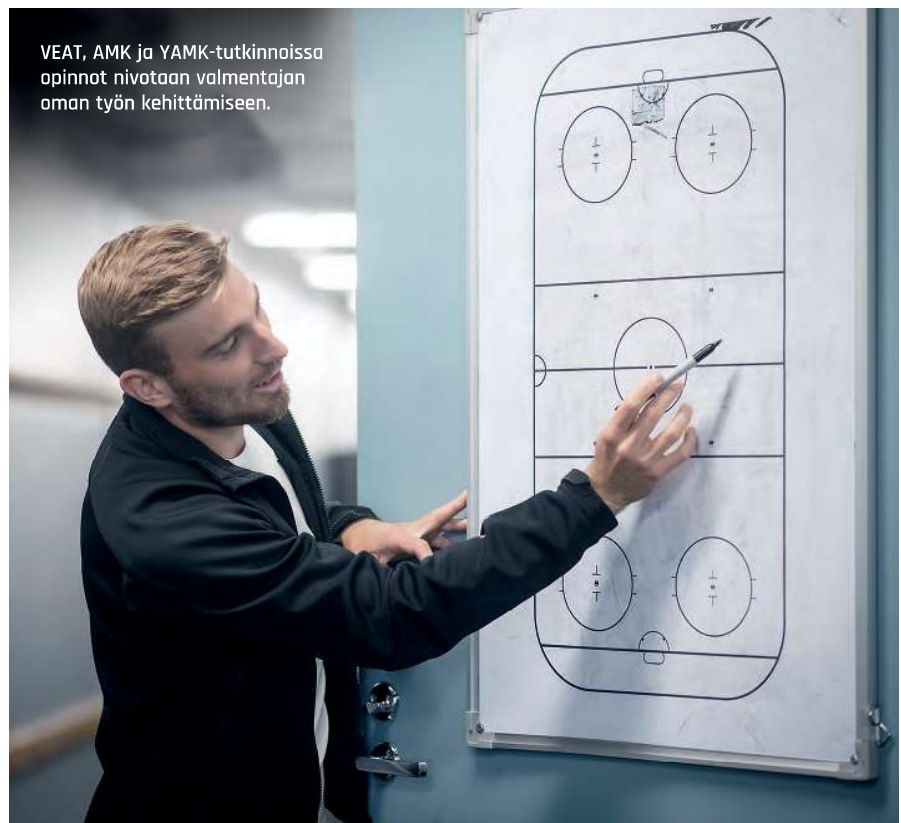
VEAT, AMK ja YAMK-tutkinnoissa opinnot nivotaan valmentajan oman työn kehittämiseen.

Valmennuksen erikoisammattitutkinnon suorittaneella on ammattitaito toimia valmennustoiminnan johtajana ja kehittää valmennuksen laatuja järjestelmää sekä kehittää