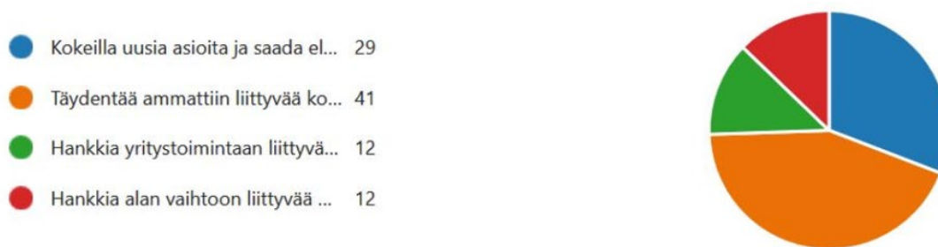
Kuvio 1. Jatkuvan oppimisen haavekohteita.

Opintojen elämyksellinen puoli on seikka, jonka kohdalla lienee syytä pysähtyä. Tämä voi tarkoittaa aivan uudenlaisia avointen amk-opintojen sisältöjä perhokalastuksesta konemusiikin opetukseen. Se voi myös tarkoittaa tavanomaisempien ammattikorkeakoulun opetussisältöjen opettamista uusin tavoin. Ensimmäisen kysymyksen haaveissa nostettiin esille seuraavanlaisia toiveita opinnoista: