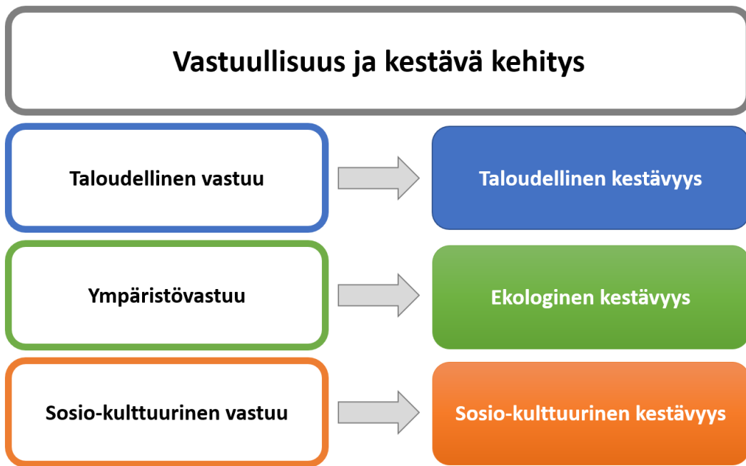
Kuvio 3. Vastuullisuus ja kestävä kehitys (Vastuullisuus 2019).