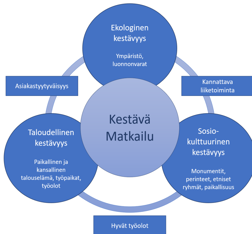
Kuvio 2. Kestävän kehityksen ulottuvuudet (Verhelä 2014, 145).

Vastuullisuuden nähdään olevan oletus matkailuyrityksen toiminnassa, jos pyritään kilpailukykyiseen ja pitkäjänteiseen yritystoimintaan. Tutkimukset ovatkin osoittaneet, että asiakastytyväisyys ja laatutaso on korkeampia yrityksillä, jotka toimivat vastuullisesti. Matkailijan näkökulmasta kestävän yrityksen toiminnasta viestii vesi- ja energiatehokkuus, jätehuollon onnistuminen, paikallisten tuotteiden ja palveluiden käyttö, paikallisten työllistäminen, kulttuuriperinnön vaaliminen sekä paikallisen väestön huomioon ottaminen. Nykyajan matkailuyrityksen tulee tiedostaa kestävän toiminnan olevan edellytys taloudellisen jatkuvuuden kannalta. (Kestävä matkailu lyhyesti n.d.) Kestävyyden toteutuminen näkyy asiakastytyväisyyden lisäksi kannattavana liiketoimintana ja hyvinä työoloina (Verhelä 2014, 146).