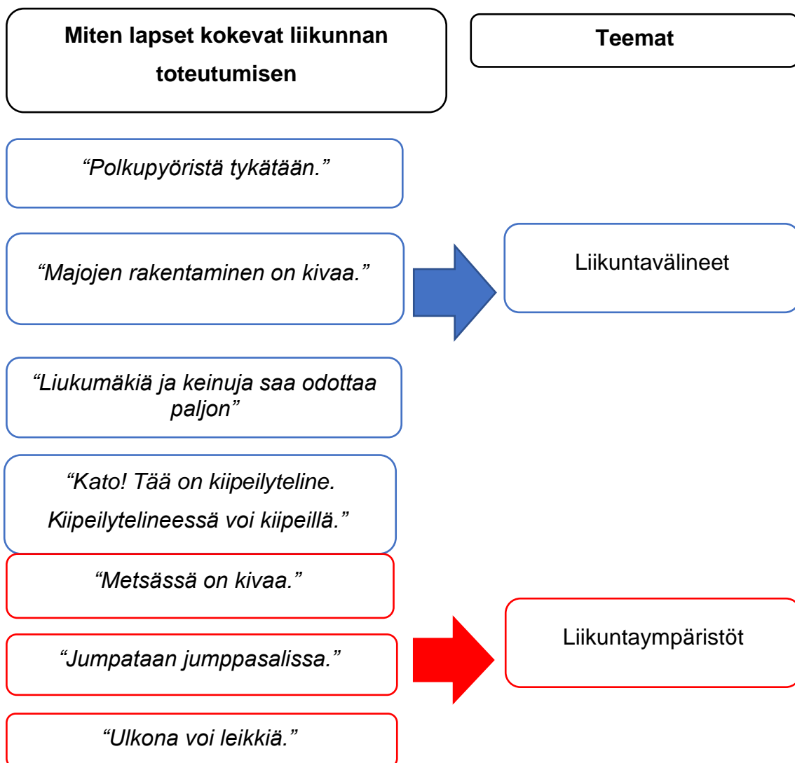
Kuvio 1. Esimerkki teemoittelusta