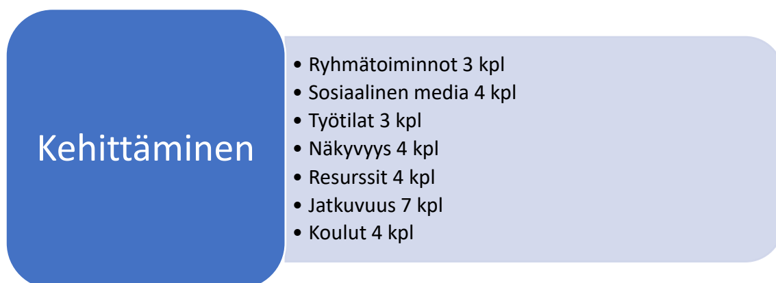
Kuva 3. Kehittämisen teemoittelu.