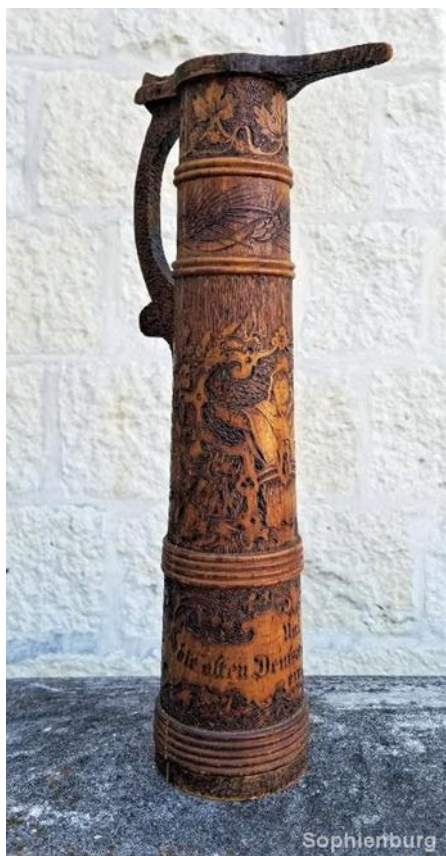
Juomasarvi. (Sophienburg 2019)

Tämä Juomasarvi on esillä Sophienburgin kotiseutu museossa Texasissa Yhdysvalloissa, se on Tehty noin vuonna 1885.