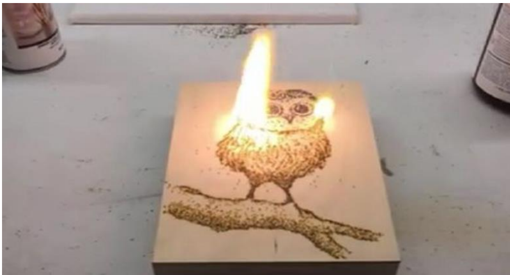
Baby Owl. Paint with gunpowder. Youtube. 18.3.2016.

Valitettavasti tämä tekniikka on hieman hankala löytää lähteitä, ja mitä vastaan tuli, niin olivat joko videoita YouTubessa tai muilla alustoilla. Ilmeisesti juuri palamisprosessin seuraaminen on enemmänkin se mikä tässä kiinnostaa, ja tämä ei nyt suoraan edes ole piirtämistä. Mielestäni se kuitenkin aiheuttaa sivuaa, joten mainitsen sen myös.