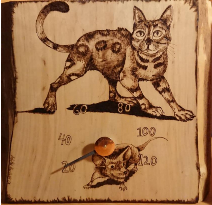
Kankaanpää. Kissa saunamittari. (2018) Aleksis Karilahti