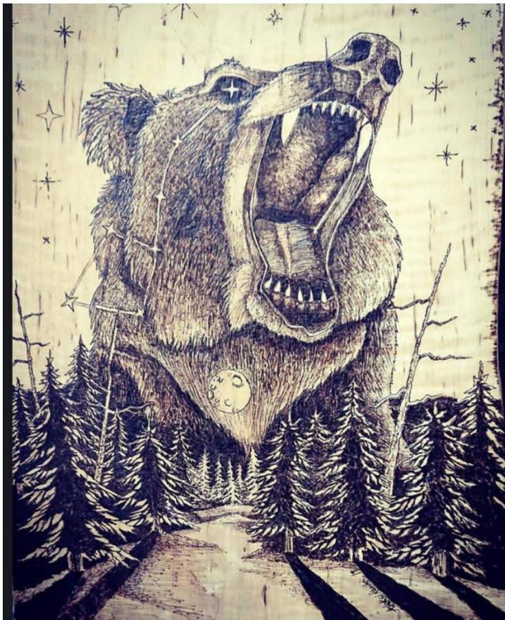
Kankaanpää. Karhu. (2019). Aleksis Karilahti.