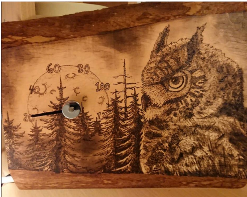
Lappeenranta. Pöllö saunamittari. (2017). Aleksis Karilahti