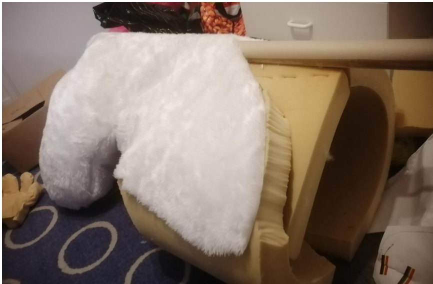
kuva 12. kroppa. 2022