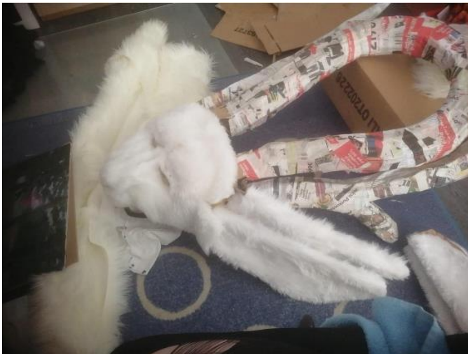
kuva 13. Pää. 2022

Päähän asensin sivu sarvet. Kaari sarvi oli haljennut paperi massaa laittaessa ja huonossa käsitellyssä. Lisäsin massaa vahtien etten tällä kertaa kuivuessa koskisi enää sarveen. Näin ne selvisivät. Sivu sarvet asentaessa olin myös niska turkin ommellut henkisesti valmistautuen, ettei kaari sarvi selviäisi ja hahmo olisi vain sivu sarvien kanssa esillä. Nyt jouduinkin avaamaan niska turkkia asentaakseni kaari sarven. Se oli kokonaan oma tappelunsa, mutta onnistui lopulta. Pään pakkasin vanhoihin lakanoihin ja ikea kassiin. Pystytys päivä koitti. Teos pysyi hyvin pystyssä. Ekana päivänä laitoin vain vaijerit. Toisena päivänä korjailin ja laitoin yksityiskohdat. Harjasin karvan ja katsoin silmien suunnan. Itse todella väsynyt näiden päivien jälkeen. Odotin vain kotiin pääsyä ja lepäämistä.