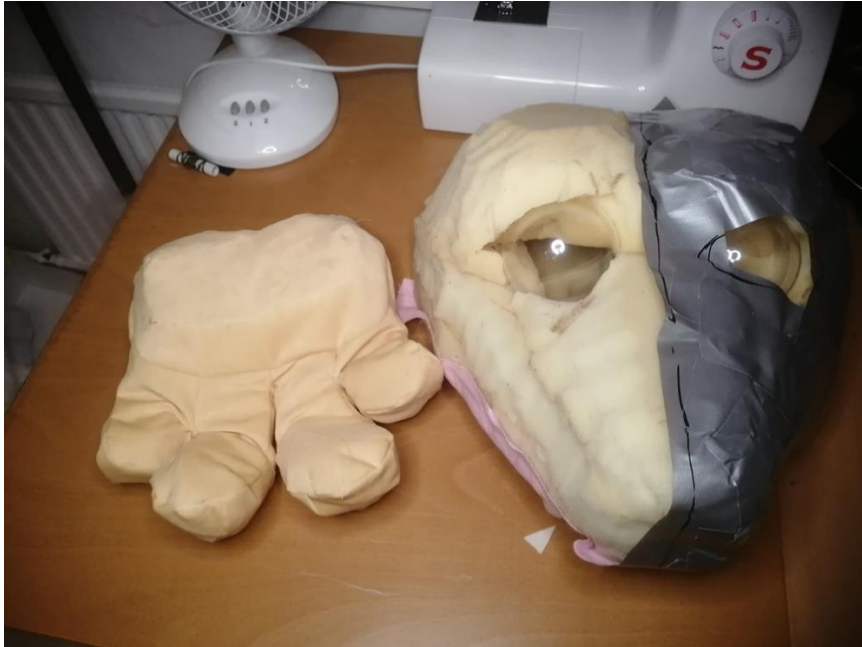
kuva 11. Etu tassu ja pää kaavan kanssa. 2021

Väriytyksestä mietitty jo maalaus tyylejä kyllä, myöskin maalien värit. itse kuvio on vielä hukassa.