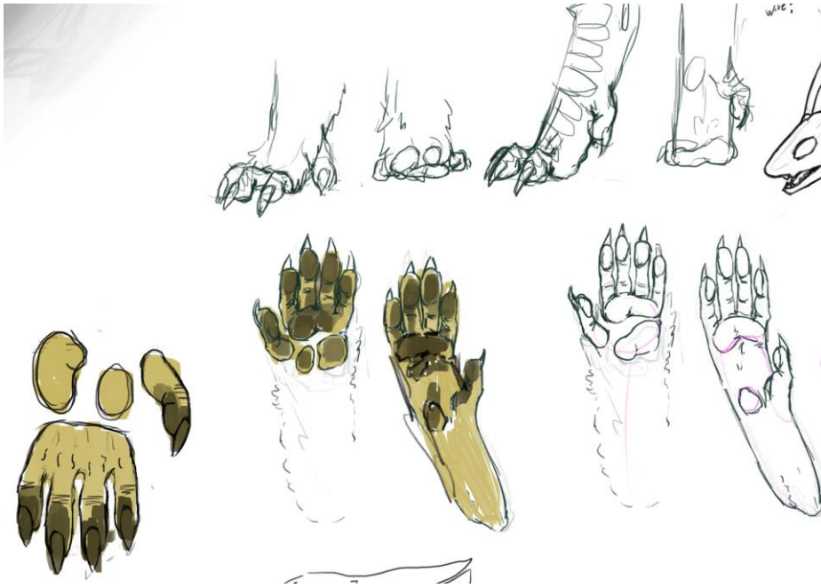
kuva 8. Hahmotelmia 2021 Iida Humisto