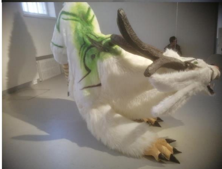
kuvat 15–16. Vartija. 2022