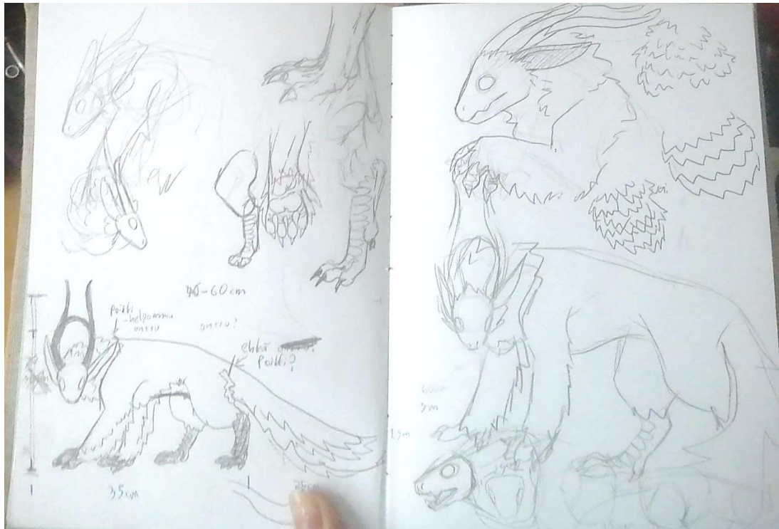
kuva 6. Hahmotelmia savikurssille. 2021 Iida Humisto