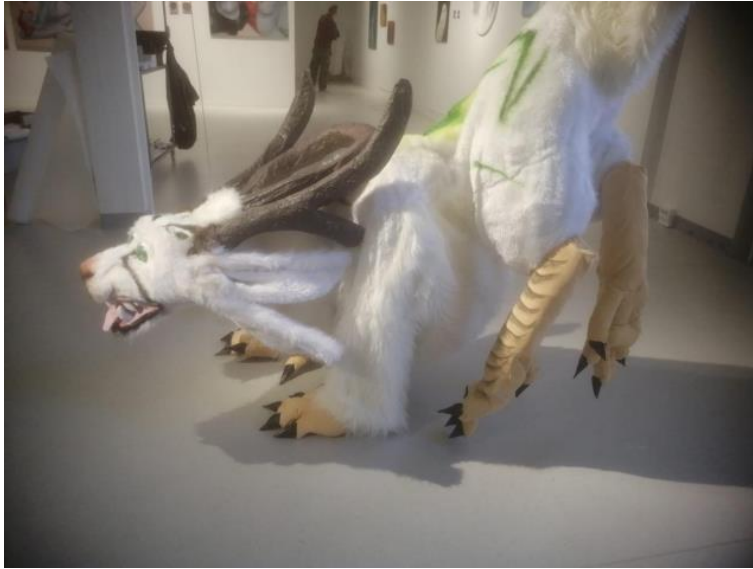
kuva 14. Vartija 2022