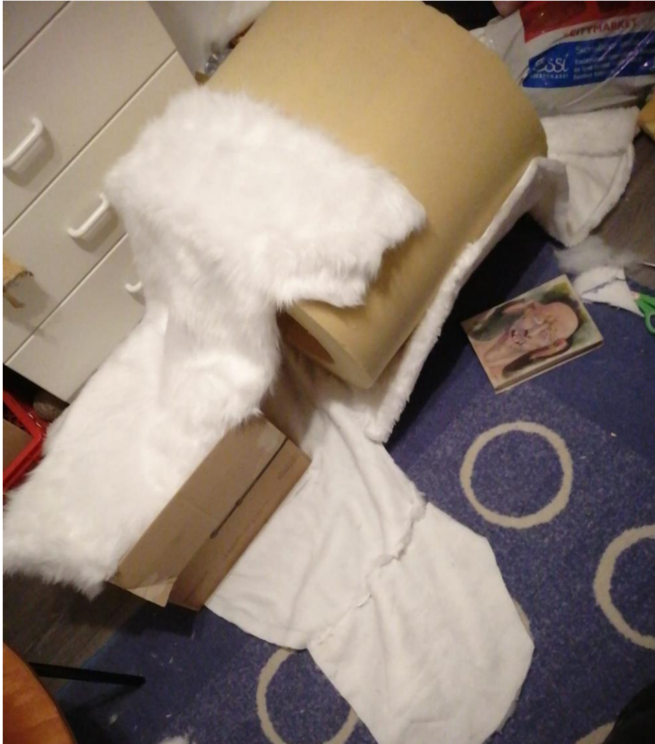
kuva 10. Runkoa ja kankaita. 2021