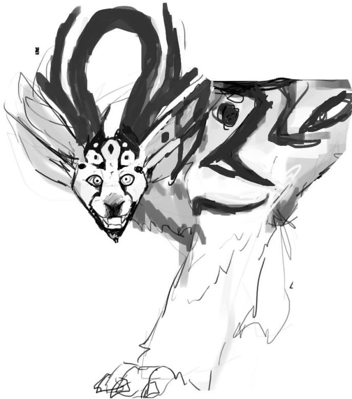
kuva 3. Vartija. 2022

Vartija hahmona oli aloitettu miettimään jo tarinaa tehdessä. Kettumainen ja suuresti lohikäärmeen inspiroima. Anatomiaa oli luotu monta eri vaihtoehtoa. Siivet, kuusijalkaa eivät käyneet järkeen miettien, että hahmo on luonnon läheinen eikä tosielämässä ole niin monimutkaisia eläimiä. Kuitenkin jonkinlainen luonnottomuuden halusinkin pitää. Kaari sarvi ei ole mitenkään mahdollinen luonnollisesti. Yhtenä synty tarinana oli ideana, että Vartija olisi syntynyt juurikosta Metsän alla.