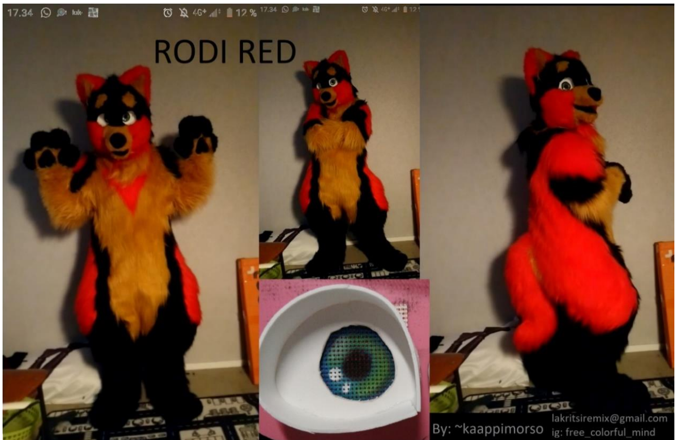
Kuva 4. Turripuku Rodi Red. Iida Humisto 2019

tästä oli myös toinen versio teoksesta, joka olisi puettava, että esille laitettava jonkin kaltaisen rungon kanssa. Nämä ideat heivasin tajutessani, että puku tarkoittaisi näyttely paikalla pysymistä pidempään ja luultavasti esiintymistä mitä henkilökohtaisesti kammoan.