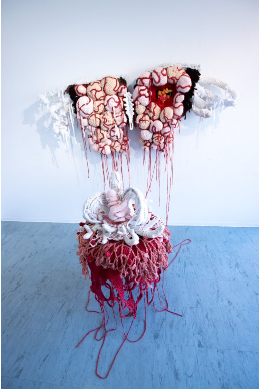
Kuva 9