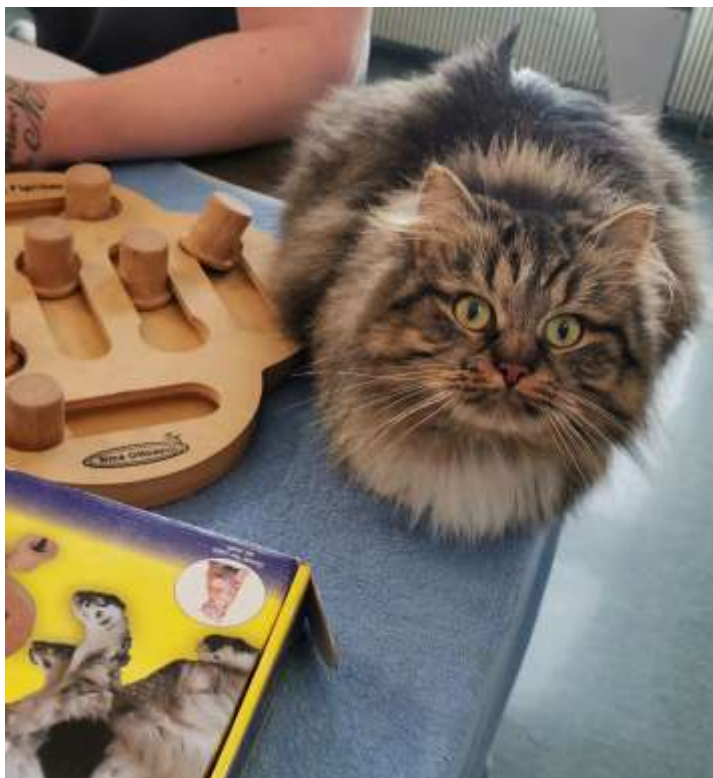
Kuva 1. Siperiankissa Nasta

” Nämä kissat ovat luonteeltaan ihan erilaisia, kun mihin olen aikaisemmin tottunut. Nämä ovat niin ystävällisiä ja seurallisia. En tiennyt, että kissat voivat olla tällaisia”