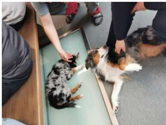
Kuva 3. Australianpaimenkoirat Myy ja Qumma

Opinnäytetyön myötä todettiin eläinavusteisen toiminnan soveltuvan myös rauhoittavaan ja rentouttavaan toimintaan. Eläimillä ja musiikilla on tunnetusti rauhoittava ja mielialaa parantava vaikutus, joten näistä elementeistä oli hyvä rakentaa toimiva päätös jokaiselle tapaamiselle. Monissa tutkimuksissa on todettu, että jo pelkkä eläinten läsnäolo voi saada aikaan ihmisessä rauhoittavan ja mielialaa kohentavan vaikutuksen. Vankien elämästä puuttuvat lähes kokonaan ihmisille tärkeät kosketus ja läheisyys. Eläinavusteisessa toiminnassa eläimen kosketus ja läheisyys tuo voimia ja tukea, eläimillä on luontainen kyky tuoda elämäniloa ja hyvää mieltä. (Green Care 2021). Ylilääkäri Soinila (2018) kertoo, kuinka musiikin myötä aineenvaihdunta ja verenkierto vilkastuu, ja jopa persoonallisuus vireytyy. Musiikin kuuntelu rauhoittaa ja rentouttaa. Musiikilla ja eläinten läsnäololla voidaan vähentää stressiä, lievittää sekä masennusta että ahdistuneisuutta. Musiikilla voidaan rauhoittaa ja palauttaa ylikerroksilla käyvä elimistö takaisin normaaliin tilaan. Tällöin vaikutus näkyy sydämen sykkeen hidastumisena ja verenpaineen laskuna. Myös hormonierityksessä tulee muutoksia, stressihormonien kuten kortisolin ja endorfiinien tasot laskevat. Musiikin ja eläinten läsnäolon myötävaikutuksella kaikki osallistujat lähtivät tapaamisesta rauhallisella, positiivisella mielellä.