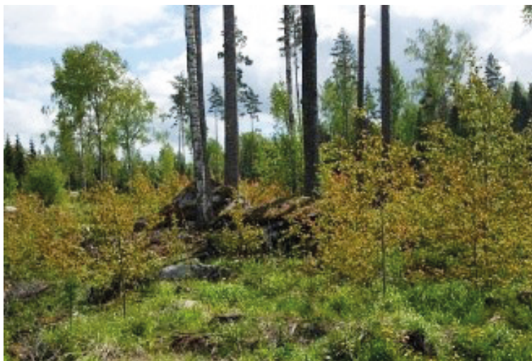
Kuva 2. Haapasäästöpuuryhmiä uudistushakkuualalla.

turvaamisen näkökulmasta arvokkaimmiksi tiedetyt puuyksilöt tulisi säästää aina kun niitä esiintyy, riippumatta siitä, voidaanko ne rajata ryhmiin vai ei (Kuva 2).