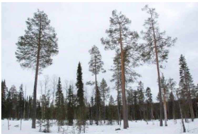
Kuva 1. Metsätalous Oy:n tekemä säästöpuuhakkuu Ylläksellä Kolarissa.

Variable retention harvesting -käsitteelle ei ole olemassa vakiintunutta suomenkielistä käännöstä. Ehdotamme tälle hakkuutavalle termiksi säästöpuuhakkuu , joka korostaa säästöpuiden merkitystä. Metsähallitus on ainakin vuodesta 2004 lähtien käyttänyt säästöpuuhakkuu-termiä kuvaamaan uudistushakkuutapaa, jossa jätetään säästöpuita selvästi tavanomaisia uudistushakkuuta enemmän metsäluonnon monimuotoisuuden turvaamiseksi. Vuoden 2004 metsätalouden ympäristöoppaan ohjeistuksen mukaan säästöpuuhakkuissa jätetään säästöpuita huolellisesti valittuina ryhminä 20–50 m 3 ha -1 . Viimeisimmän, vuonna 2018 julkaistun metsätalouden ympäristöoppaan mukaan säästöpuuhakkuu määritellään hakkuuksi, jossa säästöpuustoa jätetään tavoitteellisesti selvästi tavanomaista enemmän: vähintään 20 m 3 ha -1 tai 15 % hakkuualueen pinta-alasta. Tyypillisesti Metsähallituksen säästöpuuhakkuiden toteutuksissa jätetään tuo määritelmän mukainen vähimmäismäärä (Kuva 1).