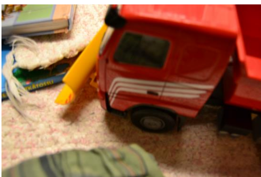
Kuva 1. Oma rekka-auto

Keskustelun lopussa annoin lasten kokeilla järjestelmäkameran käyttöä (Kuva 1 ja 2), ja suurin osa oli todella innoissaan. Ainoastaan yksi poika ei halunnut kokeilla kuvaamista, johtuen siitä, että hän oli uppoutunut satukirjojen lukemiseen, jotka olivat tukena keskustelulle, mutta veivätkin koko keskustelun huomion. Lapsille antamani palaute innosti lapsia kokeilemaan uudelleen kuvien ottamista, ja osa lapsista osasi pitää kameraa vankasti kädessään. Järjestelmäkameran suuruuden vuoksi jouduin välillä avittamaan kameran pitämisessä, koska lasten pienet sormet eivät välttämättä yltäneet laukaisimelle.