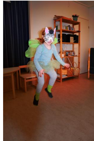
Kuva 4. Lentävä seepra

Monet lapset tulivat sanomaan minulle päivän aikana, että haluavat nähdä otettuja kuvia. Aikaisemmin olin suunnitellut, että näyttäisin kuvia vasta näyttelyssä, mutta yksi opinnäytetyöni tavoite on tutustuttaa lapsia kuvien katselemiseen, joten päätin näyttää koko ryhmälle päivän aikana otetut kuvat. Kuvien katselemisen aikana huomasin kuinka lapset olivat ylpeinä itsestään ja istuivat selkä suorana. Halkola kertoo Valokuvien terapeuttinen voima- kirjassa kuvien katselun herättävän aistimuksia, tunteita sekä muistoja ja tässä kuvien katselussa oli lapsilla selkeästi aluksi positiivisia aistimuksia itsestään (Halkola, Mannermaa, Koffert & Koulu 2009, 49). Kuitenkin kuvien katselemisen aikana kuville alettiin nauraa, ja kuvien katselemisen voimauttavasta merkityksestä tulikin päinvastainen. Aluksi ymmärsin nauramisen hyvätahoisena, mutta sitten huomasin kuinka lasten ylpeys muuttui häpeäksi, ja lapset itsekin puuttuivat asiaan toteamalla ”ei ole kivaa nauraa toisten kuville”. Tilanne jäi vaivaamaan minua ja päätin muuttaa tilanteen seuraavalla kuvauspäivällä. Keskustelimme lasten kanssa tilanteesta ja päätimme kokeilla kuvien katselemista eri tavalla. Tällä kerralla emme nauraneet kuville vaan jokainen sai sanoa toisten kuvista jotain kivaa. Tämä innosti lapsia katselemaan lisää kuvia, ja jokainen olisi halunnut näyttää itsestään muutkin kuvat kuin vain parhaat.