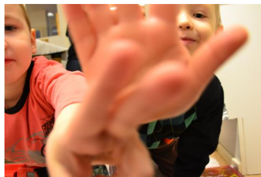
Kuva 2. Kämmenet