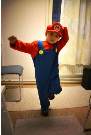
Kuva 3. Super Mario