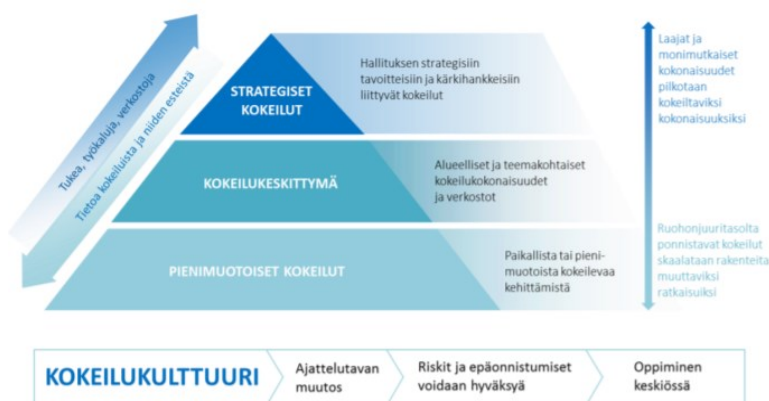
Kuva 2. Kokeilukulttuuri kokonaisuutena (Antikainen ym. 2019, 5).

Kokeileva toiminta ja kokeilukehittäminen Suomessa on ollut osa yritysten toimintaa palvelumuotoilun sekä start up- toiminnan muodoissa. Kokeilukulttuuri otettiin käyttöön suomalaiseen sanastoon 2010- luvulla. Kokeilukulttuuri Suomessa voidaan jakaa kolmeen tasoon: strategiset kokeilut, kokeilukeskittymät sekä pienimuotoiset kokeilut (kuva 1). Strategiset kokeilut ovat hallituksen kokeiluja. Kokeilukeskittymät ovat alueellisia tai teemallisia kokeiluverkostoja. Pienimuotoisten kokeilujen, kuten Tervaväylän Hyvinvoinnin vuosikello, ensisijainen tavoite on käytännön testaaminen, jonka jälkeen kokeilusta saatu tieto voidaan tuoda päätöksentekoon. Kokeiluilla on aina selkeä alku ja loppu, sekä tavoite, jota testataan rajatulla joukolla. (Antikainen ym. 2019.)