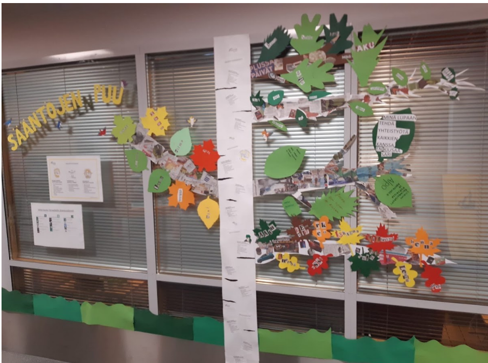
Kuva 3 Tervaväylän Hyvinvoinnin vuosikellon tuokioilla koulun oppilaiden kokoama koulun sääntöjen puu. (Karhu 2021).

Sain opinnäytetyön tilaajalta luvan aineiston keräämistä varten. Havaintojani olen tehnyt järjestelmällisesti oman tiimini vuosikellon tuokioiden aikana viikoittain aktiivisena osallistujana. Tervaväylän työntekijänä havainnoitsijan roolini on ollut kuitenkin myös ulkopuolinen tarkkailija erityisesti vuosikelloon liittyneissä moniammatillisissa keskusteluissa sekä palavereissa. Käytin tutkimuksessani myös luotaimia valokuvaamalla Tervaväylän Hyvinvoinnin vuosikellon tuokioista syntyneitä materiaaleja (kuva 3). Havaintoni on ollut strukturoimatonta ja olen pyrkinyt havainnoillani selvittämään missä määrin tuokioita on toteutettu ja millaista moniammatillista yhteistyötä tuokiot ovat synnyttäneet.