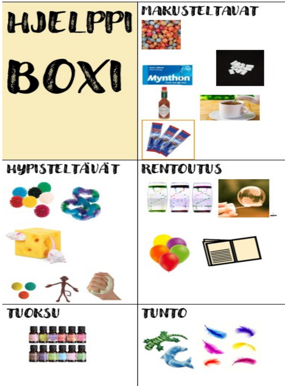
Liite 2. Hjelppiboxin tuotesisältö.