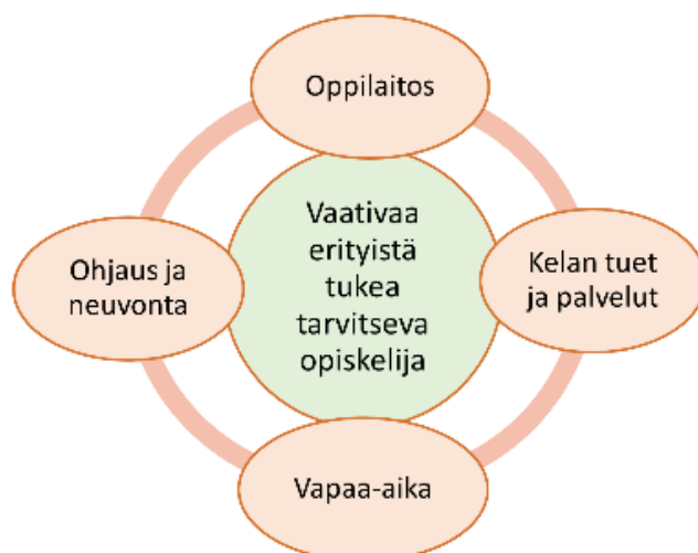
Kuva 4. Vaativaa erityistä tukea tarvitsevan opiskelijan ohjaus- ja tukiverkoston nelikenttä ammatillisessa koulutuksessa ja sen nivelvaiheissa

Vaativaa erityistä tukea tarvitsevan nuoren ohjaus- ja tukiverkosto ammatillisessa koulutuksessa ja sen nivelvaiheissa muodostaa nelikentän, jonka osia ovat: 1) oppilaitos, 2) Kelan tuet ja palvelut, 3) vapaa-aika 4) muu ohjaus- ja neuvonta (kuva 4).