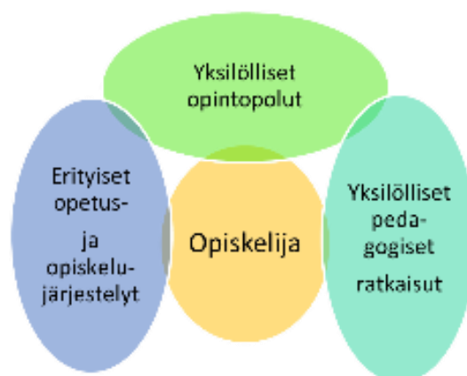
Kuva 3. Vaativan erityisen tuen muodot ammatillisessa koulutuksessa

Vaativaa erityistä tukea tarvitsevan opiskelijan koulutuspolun sekä urasuunnitelman kartoittamisessa on huomioitava opiskelijan sairaus, vamma tai laajat oppimisvaikeudet. Koulutuksen hakeutumisvaihe sekä jatko-opinnoista selviytyminen vaativat tavallista enemmän yksilöllistä ohjausta. (Niemeläinen 2020, 16.) Näille nuorille koulutuksellisen tasa-arvon sekä ihmisoikeuksien toteutuminen ovat riippuvaisia tarjotusta tuesta. Vammaisille nuorille suunnatut koulutus- ja tukijärjestelmät kannattelevat ja ohjaavat erityistä tukea tarvitsevia nuoria, joiden varassa he suunnittelevat tulevaisuuttaan. Nivelvaiheen koulutus- ja uraohjaus on tämän vuoksi erittäin merkityksellistä etenkin perusopetuksen oppilaille. (Niemeläinen 2020, 94–95.)