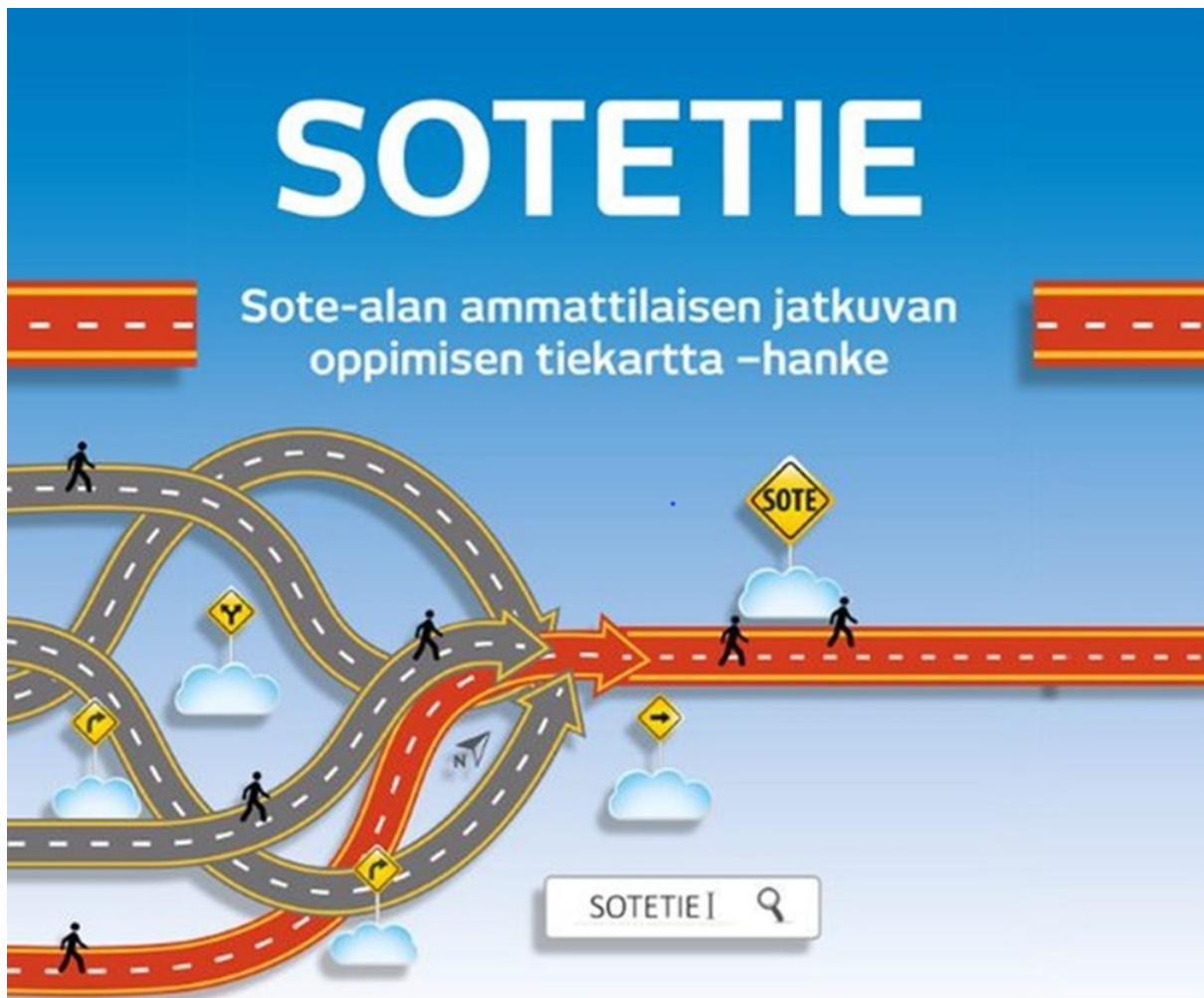
Kuva 1 SOTETIE-hankkeen tunnuskuva

(ESR) rahoittaman Sote-alan ammattilaisen jatkuvan oppimisen tiekartta (SOTETIE) -hankkeen (kuva 1) yhtenä tehtävänä on selvittää sosiaali- ja terveysalan (SOTE) työelämätahon näkemyksiä jatkuvan oppimisen kehittämiseksi.