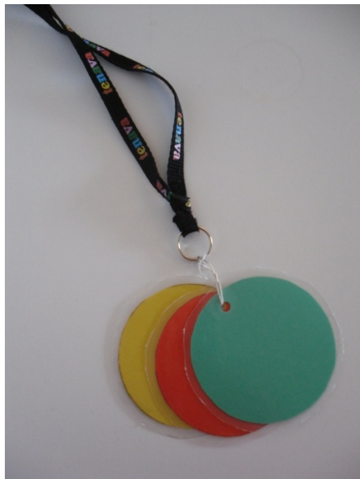
Bild 7 Trafikljusen

Trafikljusen är ett bra sätt att kunna ge ett barn positiv feedback på annat sätt än verbalt. Trafikljusen är uppbyggda av tre stycken bollar, en grön, en gul och en röd. Då pedagogen är nöjd med vad barnet gjort, kan man visa den gröna bollen och samtidigt ge verbal feedback som till exempel "Vad fint du sitter på rumpan med fötterna framåt". Då barnets beteende börjar gå mot det förbjudna, kan den vuxna visa den gula bollen och säga att "Lugna ner dig" och ifall ett barn gör något förbjudet kan man med hjälp av den röda bollen förstärka det verbala förbudet. Den vuxna kan visa den röda bollen och samtidigt säga att "Det är absolut förbjudet att..".