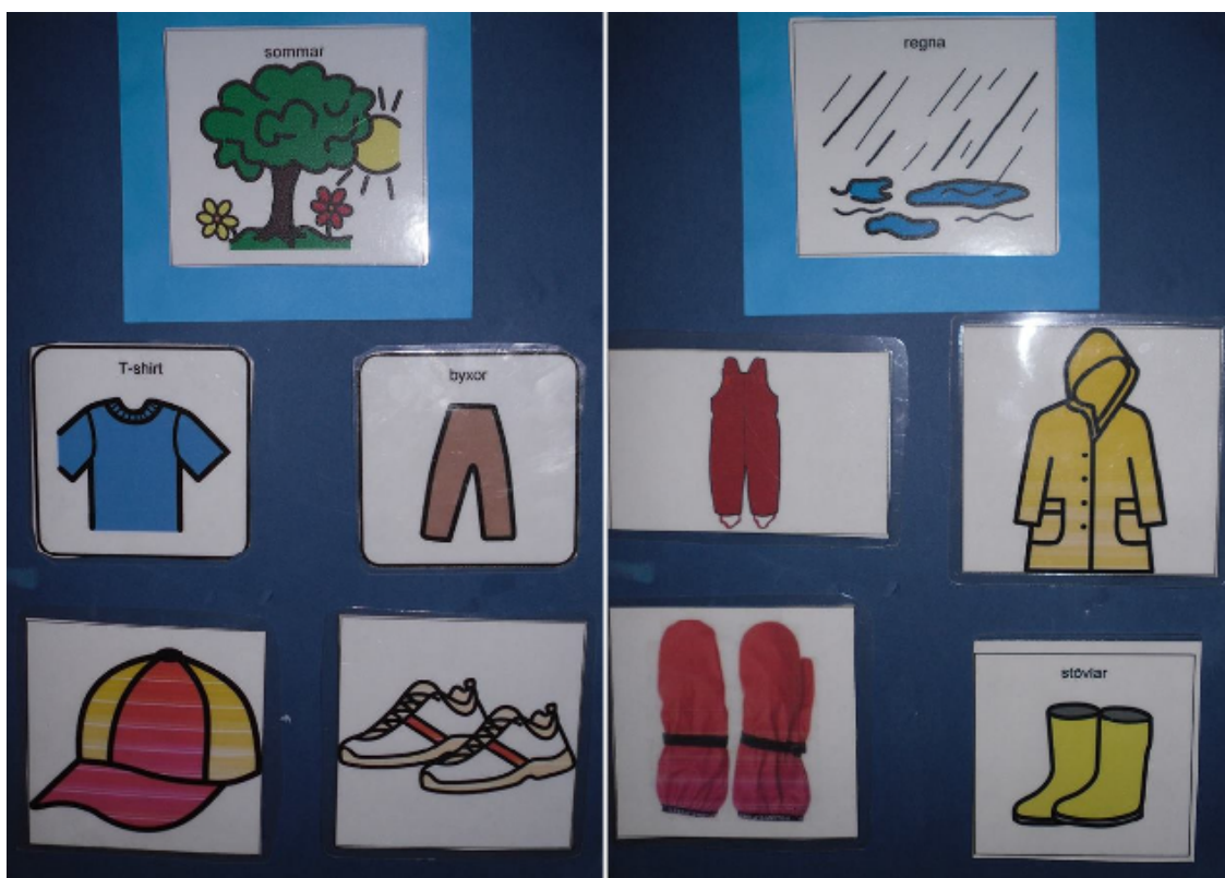
Bild 8 Påklädnings karta

Barn kan ha svårt med att veta var de ska börja med påklädningen. Uttrycket "Klä på dig" kan vara för abstrakt för barn och därför drar alla barn nytta av en påklädningskarta för att veta vad de skall sätta på sig och i vilken ordning. Högst uppe på påklädningskartan visar en bild hurdant väder det är och under väder bilden ligger vilka kläder som skall kläs på.