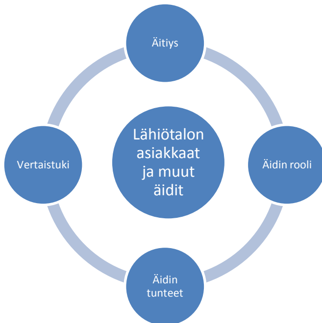
Kuvio 1. Opinnäytetyön keskeiset käsitteet.

ympärillä, ovat opinnäytetyön tietoperustan keskeisimmät käsitteet. Ylimpänä on äitiys, joka on perustana koko opinnäytetyölle. Äitiyden näkökulmasta käsitellään äidin roolia, äidin positiivisia ja negatiivisia tunteita sekä vertaistukea.