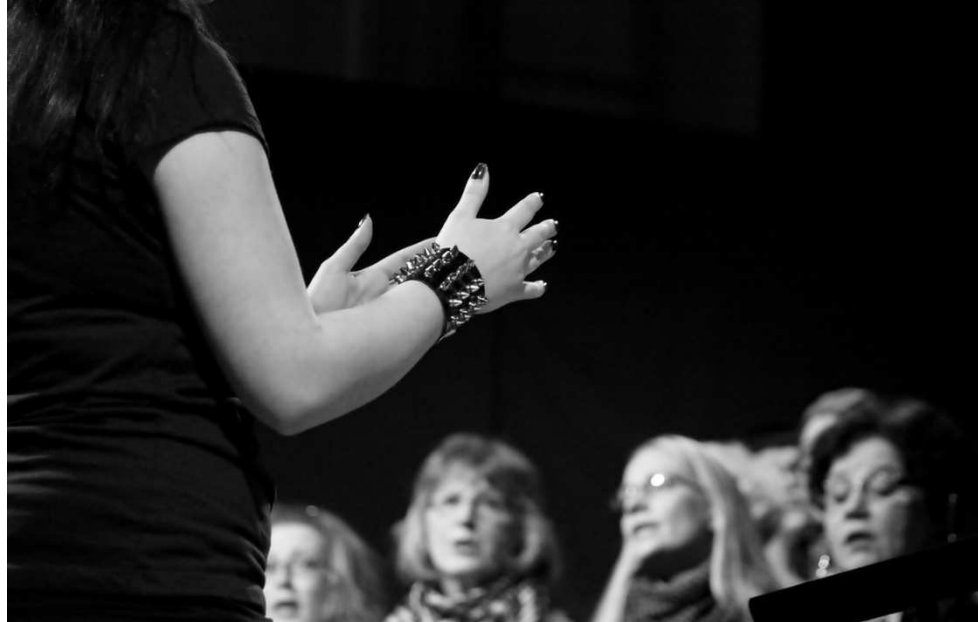
KUVA 6. A cappella -laulun lumoissa.

yksin, vaan kanssani vuoren huipulle kiipesi joukko innostuneita, asiaan paneutuneita kuorolaisia.