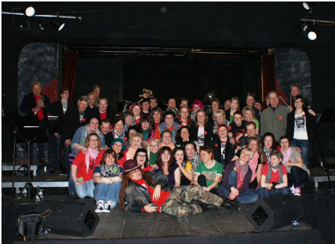
KUVA 1. Koko työryhmä koolla.