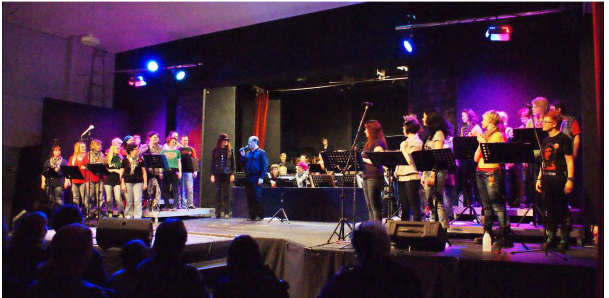
KUVA 5. Kuoron ja orkesterin sijoittuminen esiintymislavalle.

teria sen edessä, jolloin kuoro jäi Eirolan selän taakse. Tämä tietysti tarkoitti, että kuorolaiset eivät nähneet Eirolaa, mikä oli ongelmallista lähtöjen ja muiden näyttöjen osoittamisen kannalta. Ongelma ratkaistiin heijastamalla videokameralla live-kuvaa Eirolasta konserttisalin takaseinään, jolloin kuorolaiset näkivät johtajan merkit sieltä. Näin solisteille jäi tilaa lavan etu- ja keskiosaan. Suunnitelma toimi hyvin, eikä häirinyt konserttiyleisöä.