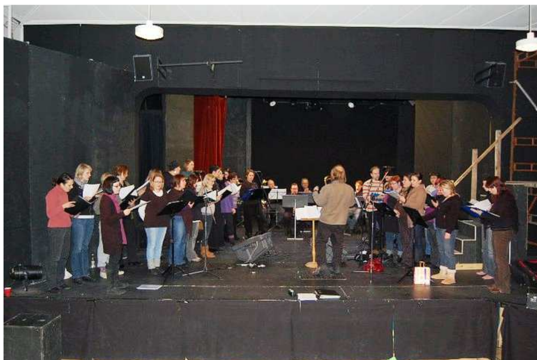
KUVA 3. Ensimmäiset yhteisharjoitukset.