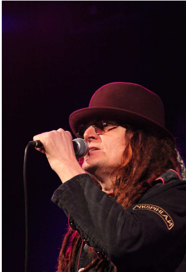
KUVA 2. Pelle Miljoona Ykspihlajassa.

Pellen ura punk-artistina alkoi vuonna 1977, kun hän opiskeli Savonlinnan Opettajankoulutuslaitoksessa. Punk teki tuolloin tuloaan ja Pelle oli Lontoossa käydessään tutustunut kyseiseen ilmiöön. Punk-musiikille tyypillinen kantaottavuus lienee syy siihen, miksi Pellestä tuli punk-muusikko. Hänelläkin oli sanottavaa sen hetkisestä maailman menosta. (Laamanen 2005, 10.)