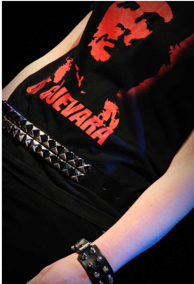
KUVA 4. Asusteet ja vaatetus luovat yhtenevän ilmeen.

kuin yksi iso instrumentti, jossa yksilöt eivät niinkään korostu (Uggla 1979, 99). Työryhmä selvitti, mitkä asiat muodostavat uskottavan punk-tyylin. Yhteiseksi asuksi sovittiin farkut, yksivärinen t-paita, mähkouskengät tai tennarit sekä asusteiksi esimerkiksi pinssejä, huiveja ja niittirannekkeita. Teetimme konsertteja varten omia rintamerkkejä, erivärisen kuhunkin esitykseen. Niitä jaettiin yleisölle lipunmyynnin yhteydessä.