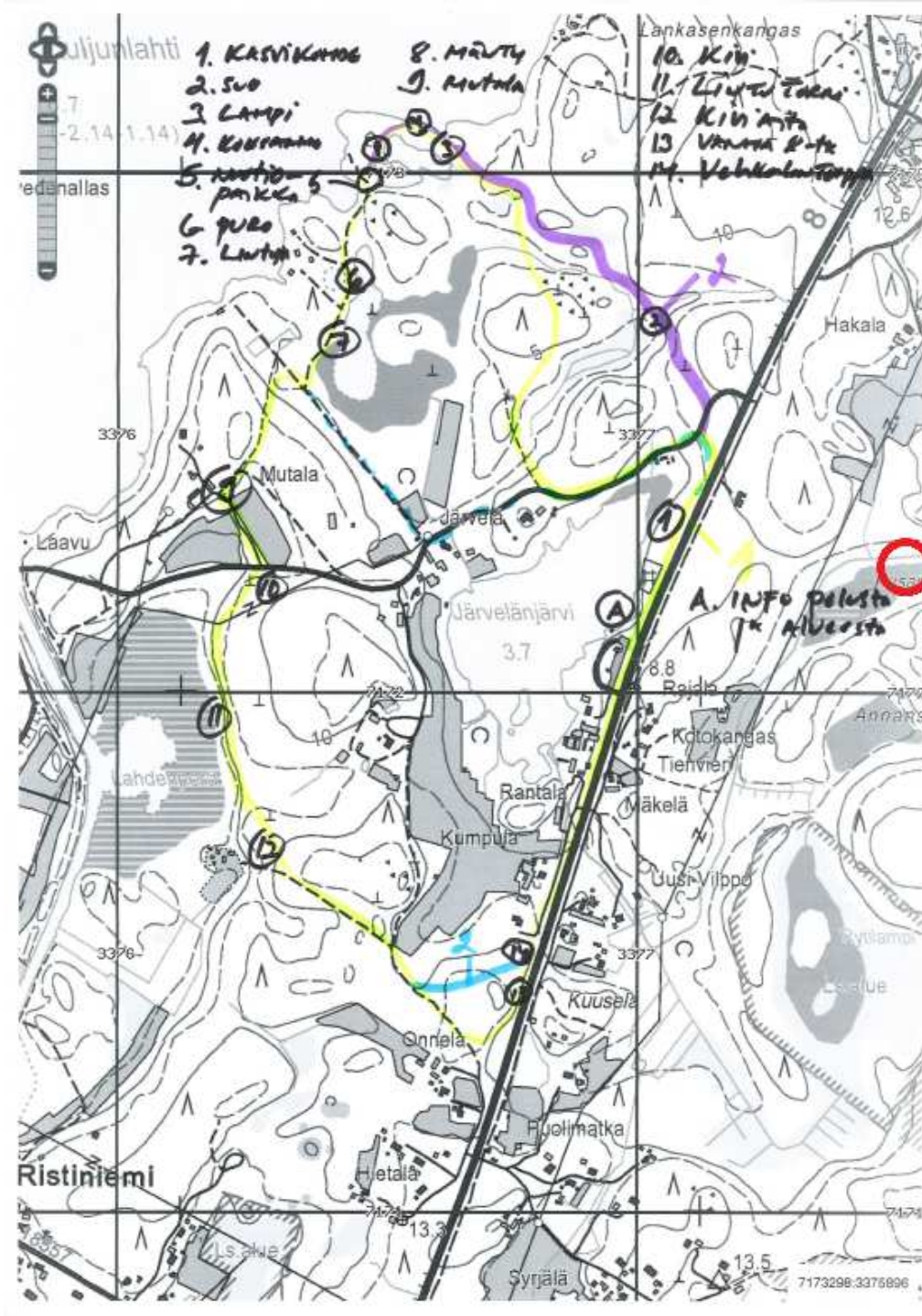
Kuva 9. Kuva alueelle suunnitella olevasta luontopolusta. Pusan laavu merkitty karttakuvaan punaisella ympyrällä.