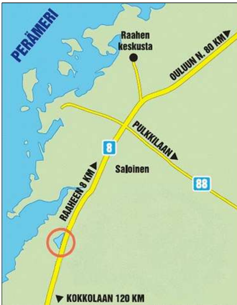
Kuva 1. Suunnittelualueen sijainti.

Suunnittelualueena on Raahen kaupungista kahdeksan kilometriä etelään sijaitseva Järvelänjärven levähdyspaikka valtatie kahdeksan varrella. Alue kuuluu Haapajoki-Arkkukari-kyläyhdistys Ry:n toiminta-alueeseen, ja siellä sijaitsee kyläyhdistyksen kyläpirtti. Tämä on ainoa järvenrannalla sijaitseva levähdyspaikka Turku-Muonio välillä, joka tavoittaa matkailijat. Alueen sijainti on esitetty kuvassa 1.