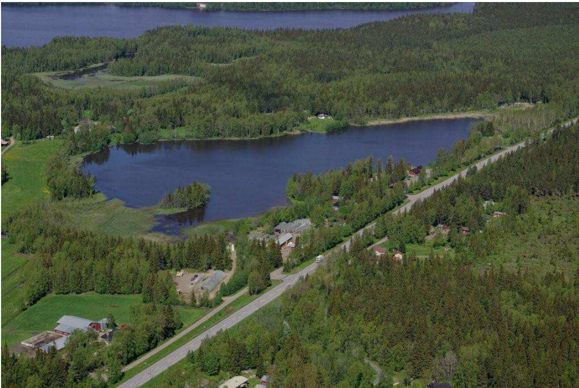
Kuva 6. Ilmakuva alueen nykytilasta

Alueen nykyiset toiminnot ja niiden kehittäminen tarjoavat osaltaan mahdollisuuden monipuolistaa alueen palvelutarjontaa. Tavoitteena on sovittaa uudet toiminnot osaksi alueen maisemaa ja huomioida luonnonympäristön erityispiirteet.