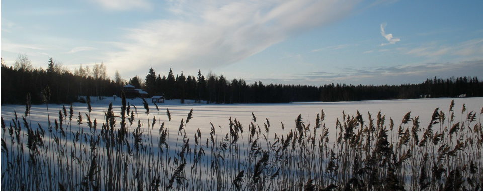
Kuva 4. Maisemat pohjoisrannalta