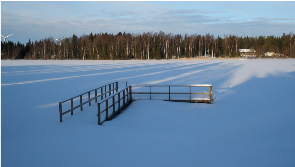
Kuva 5. Maisemat länsirannalta