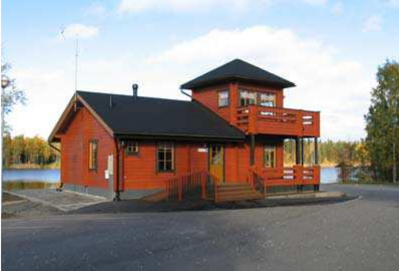
Kuva 2. Nykyinen kyläpirtti.