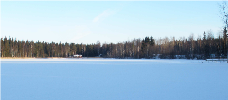
Kuva 3. Maisemat Järvelänjärven etelärannalta

Levähdyspaikka sijaitsee siis valtatie kahdeksan ja Järvelänjärven välissä. Valtatie läheisyys häiritsee muuten hienoa maisemakuvaa ja rikkoo alueella vallitsevaa rauhallisuuden tunnetta. Valtatie tuomia haittoja tasapainottaa ainutlaatuinen järvimaisema. Järven keskisyvyys on noin yksi metri. Järvi on tyyni ja puhdas, mutta järvessä ei elä kaloja. Järven rannat ovat paikoitellen pensoittuneet. Järveä ympäröi kaunis metsäinen maisema.