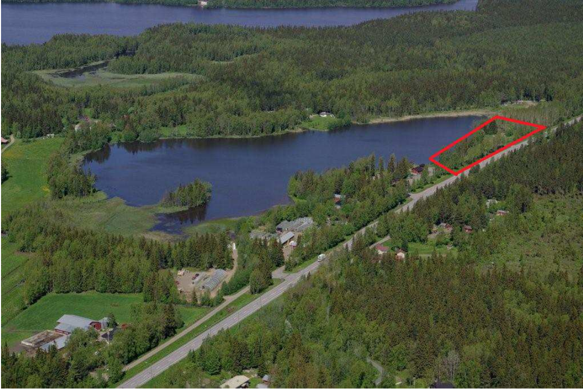
Kuva 7. Maa-alue merkitty kuvaan punaisella kehikolla

Mikäli kyseisen maa-alueen hankinta toteutuu, rakennutetaan maa-alueelle toinen liittymä. Toisen liittymän avulla etenkin pohjoisen suunnasta tulevien matkailijoiden olisi helpompi saapua levähdyspaikalle.