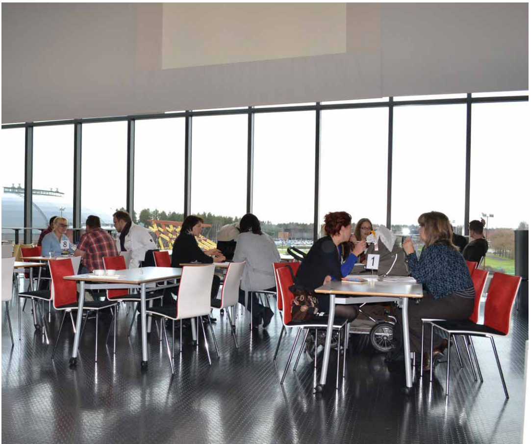
Kuva 4. Pohjois-Karjalan Luotu-päivä järjestettiin Joensuussa 15.11.2012.