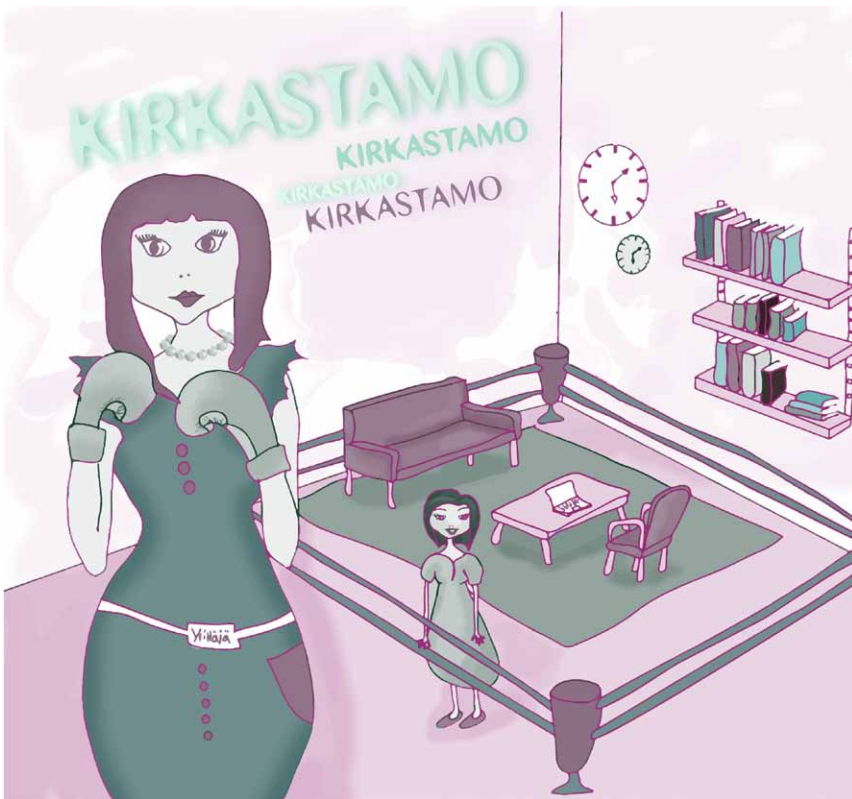
Kuva 5. Kirkastamo-klinikat pyrittiin järjestämään muiden luovien alojen tapahtumien yhteydessä, jolloin klinikan paikka vaihteli Tiedepuiston kokoushuoneista ravintola Kerubin takahuoneeseen. Tärkeintä klinikan paikassa oli, että asiakkaan oli sinne helppo tulla.