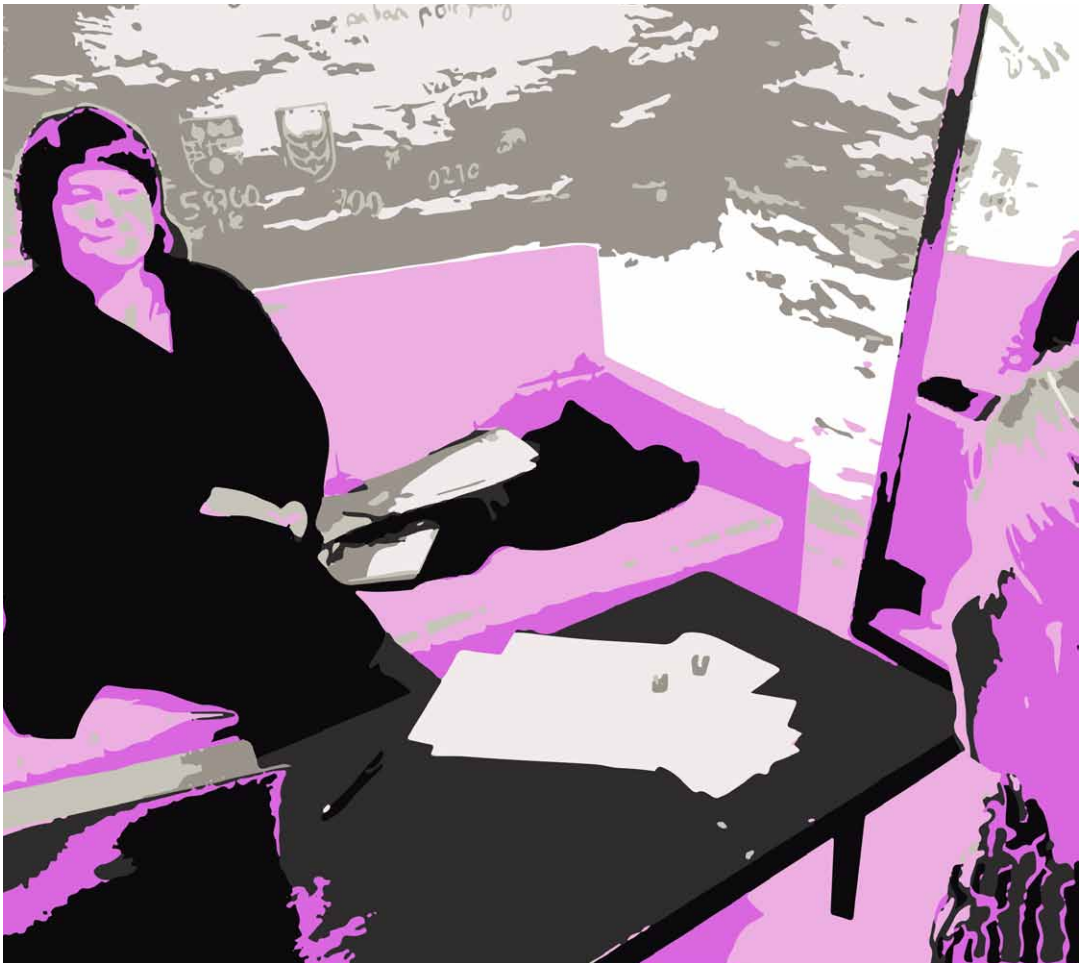
Kuva 1. Kirkastamo-klinikan keskeisenä tavoitteena oli auttaa luovien alojen yrityksiä, yrittäjiä ja yrittäjiksi aikovia parempaan ja kannattavampaan liiketoimintaan.