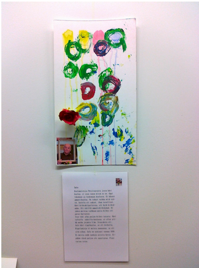
Kuva 6. Taidenäyttely

Lehtiartikkeli 3.5.2012 Joutseno (Rantala 2012)