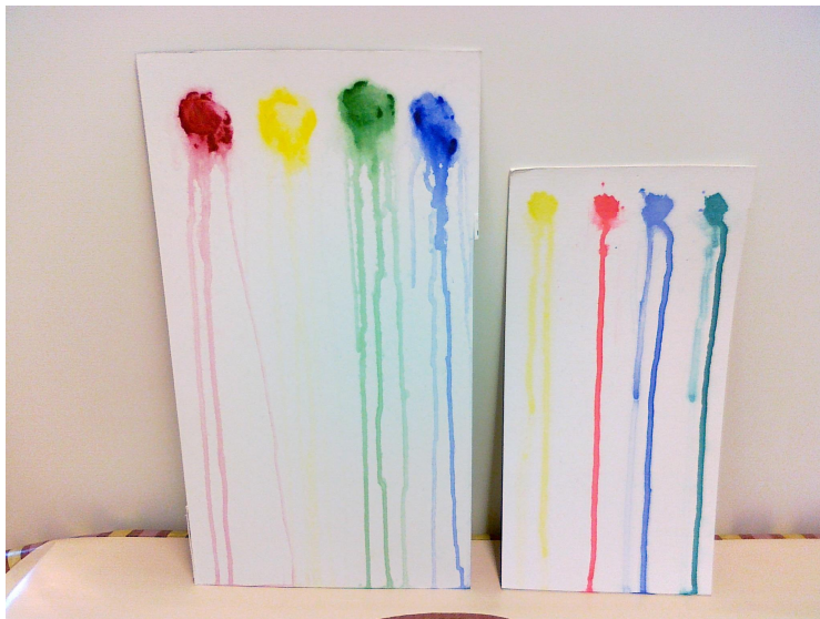
Kuva 2. Väritäpläkoe.

Kokeilimme Annukassa myös vesiväritekniikkaa, jossa väritäplään suihkutetaan suihkepullolla vettä. Kokeilu onnistui hyvin ja kuvassa olevat mallit saatiin mukaan, kuvaamaan varsinaista toimintaa nuorille ja ikäihmisille. Tehtävien tekeminen ennakkoon auttoi mitoittamaan työtehtäviä sopivaksi kohderyhmälle.