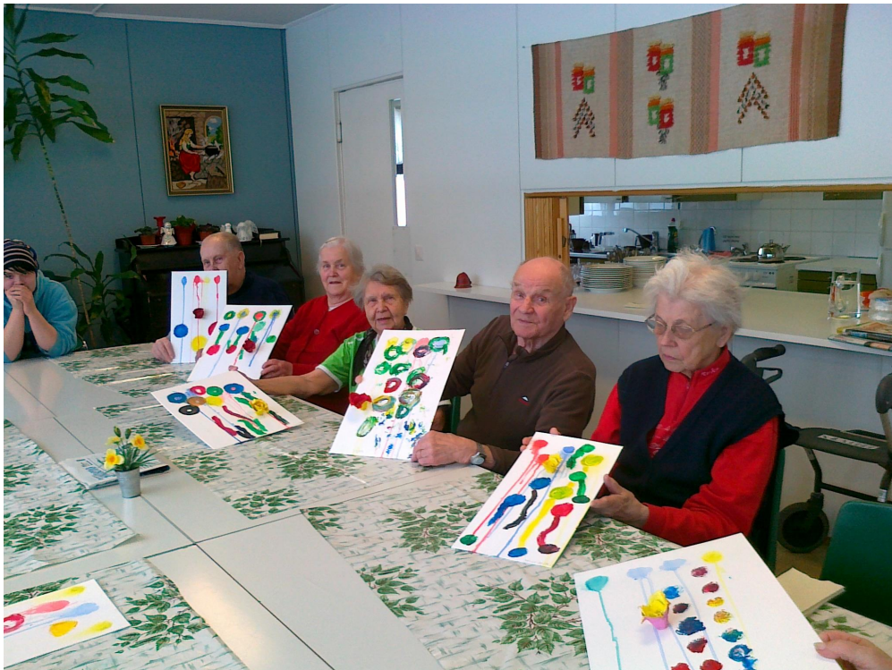
Kuva 5. Yhteiskuva.