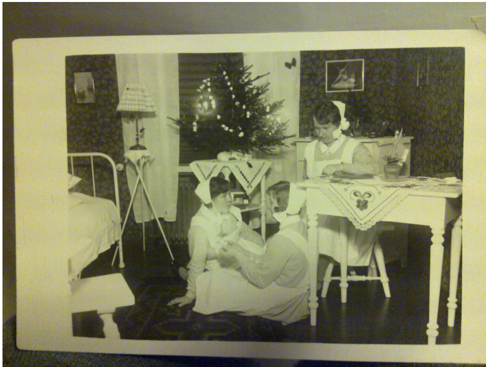
Kuva 1. Ennen vanhaan.

Taksi toi osallistujat klo 9.00 Annukka-pajan pihaan. Vanhustentalolla asuvat tulivat paikalle kävellen. Toivotimme tulijat tervetulleeksi. Liikkuminen on joillekin hankalaa; joku liikkui pyörätuolilla, jotkut rollaattorilla, muutama kepin kera. Kahvin juotuamme siirryimme luokkatilaan, johon olin laittanut muutamia vanhoja valokuvia esille.