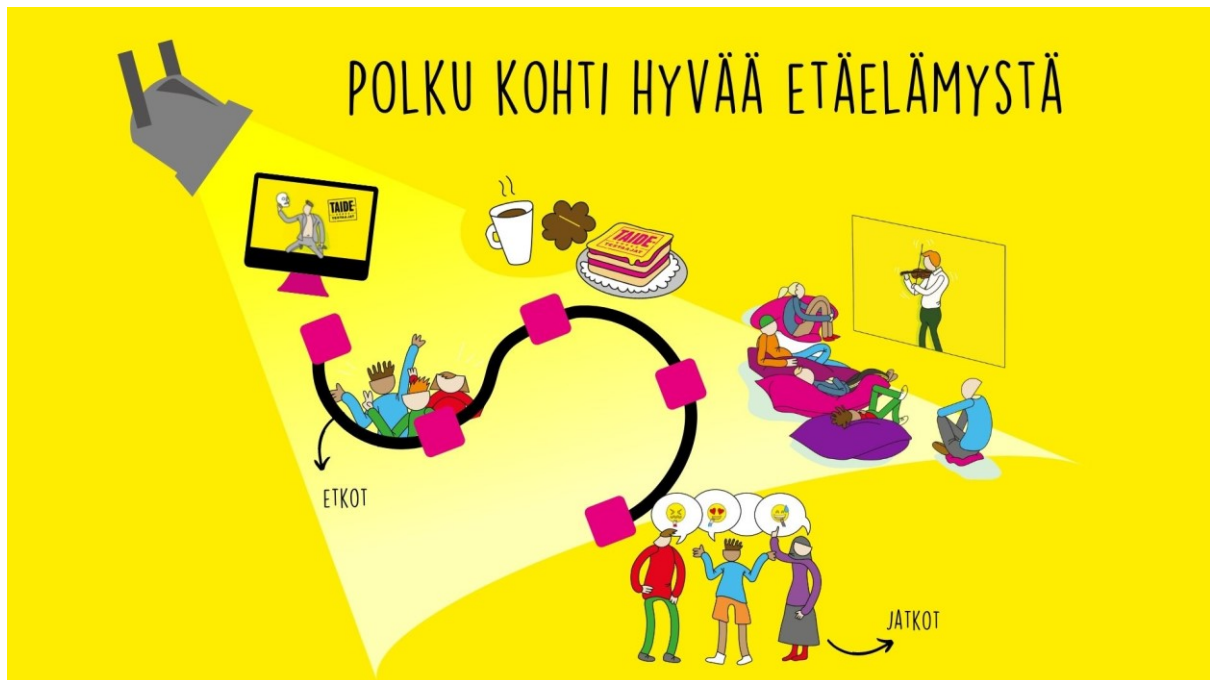
Kuvio 4. Visuaalinen mallinnus etäelämyksen kokonaisuudesta.

Kävin marraskuussa 2021 teatteriesityksessä. Teos oli Red Nose Companyn RÉvolution. Esi-tyksen aikana kiinnitin erityistä huomiota elämyksellisyyteen ja sen aikaansaamiseksi käytettyihin keinoihin. Toki kokemus on aina subjektiivinen, mutta tärkeimpänä asiana koin erityisesti itse esityksen. Lisäksi arvaamattomuus ja ennakoimattomuus olivat merkittävä osa koke- mustani. Tämän kaltaista yllätyksellisyyttä voisi mielestäni etäelämyksiin tuoda esimerkiksi valmistelemalla etäelämystilaisuuden toiselle luokalle. Myös tämän havainnon halusin esitellä tuotoksissa, sillä näkisin sen tuovan toivottua “retkikokemusta” myös etäelämykseen.