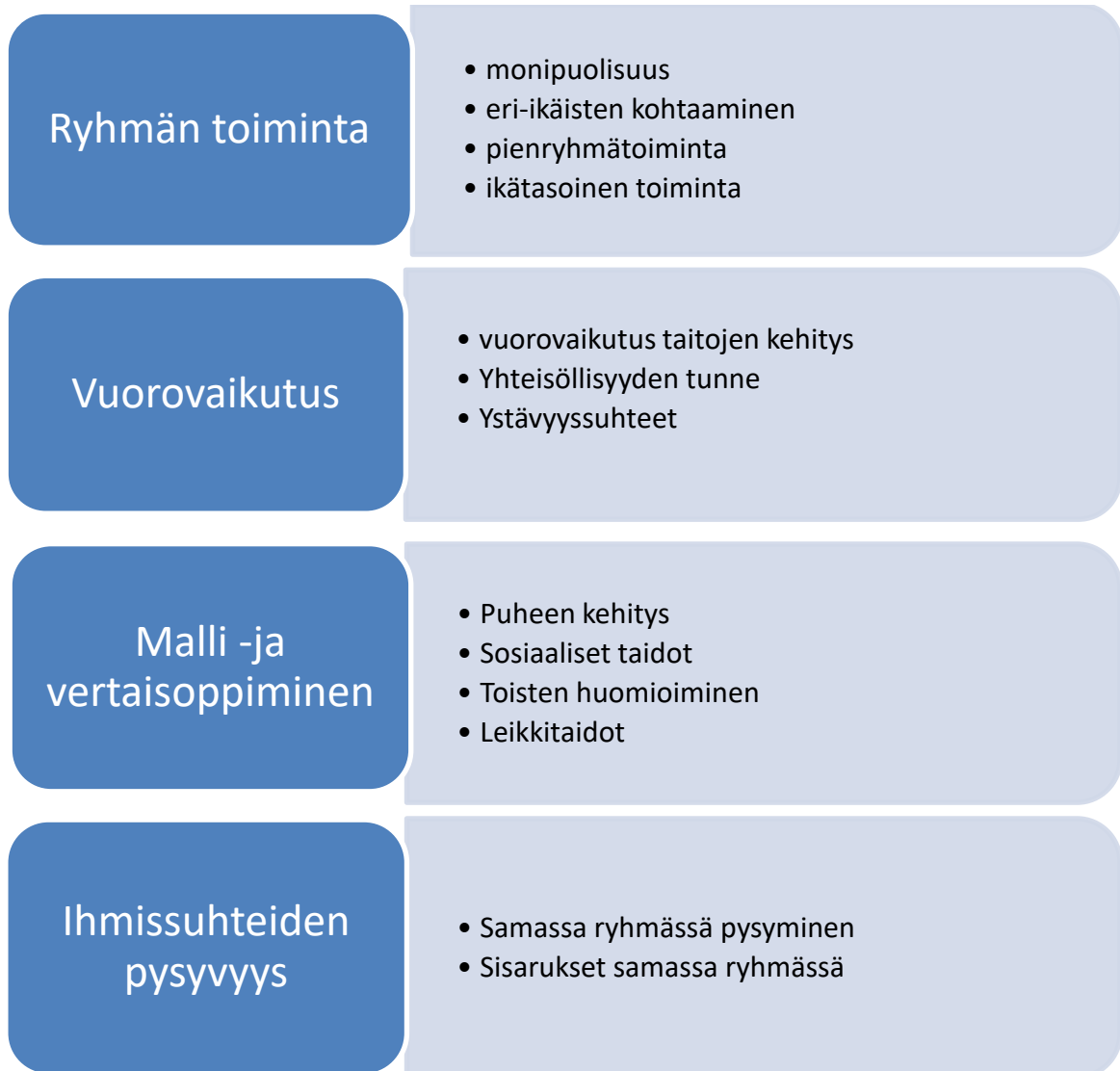
Kuva 2. Aineiston teemat