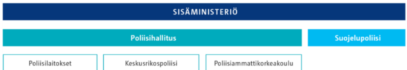
Kuva 3. Poliisin organisaatio. (Poliisiammattikorkeakoulu 2021.)

Poliisihallituksen johtamassa poliisiorganisaatiossa kansalliseen turvallisuuteen kytkeytyviä tehtäviä kuuluu sekä valtakunnallisena yksikkönä toimivalle keskusrikospoliisille että paikallisille poliisilaitoksille. Suojelupoliisi toimii omana valtakunnallisena yksikkönään sisäministeriön alaisuudessa (kuva 3).