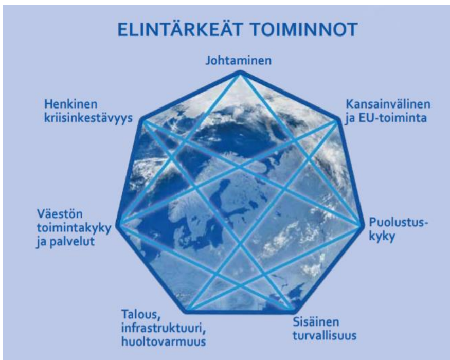
Kuva 1. Yhteiskunnan elintärkeät toiminnot (Turvallisuuskomitea 2017b, 7)

Kokonaisturvallisuuteen sisältyy yhteinen riskien ennakointi, varautumisen suunnittelu, koulutus ja harjoittelu kaikkien yhteiskunnan toimijoiden osalta, mikä luo valmiuden turvata yhteiskunnan elintärkeät toiminnot. Viranomaisille on jaettu toimintojen turvaamiseksi vastuutehtävät ja jos tilanne sitä vaatii, toimivaltaista viranomaista on pystyttävä tukemaan kaikilla yhteiskunnan käytettävissä olevilla voimavaroilla. (Turvallisuuskomitea 2017b, 9.)