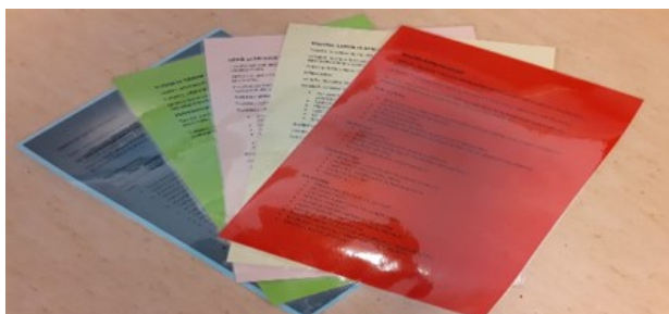
Kuva 3. Osaamisaluekortit.

tin kehittymistä, tutustutaan omaan historiaperspektiiviin, opetellaan hyväksymään ihmisten moninaisuutta ja erilaisuutta, vahvistetaan ajantajua sekä opetetaan vastuullisuutta omasta ja muiden mediaan liittyvästä hyvinvoinnista. Ilmaisun monet muodot tulostettiin siniselle paperille ja se sisältää materiaalia, jonka avulla vahvistetaan lasten suhdetta ja kiinnostusta musiikkiin, tarjotaan kokemisen ja oivaltamisen iloa sekä nautintoa omasta työstä, spontaanista ilmaisusta, yhteisestä suunnitteluprosessista sekä ohjataan tulkitsemaan ja kertomaan ajatuksia kuvallisista viesteistä. Kasvan, liikun ja kehittyn -osaamisaluekortti tulostettiin keltaiselle paperille ja siihen koottiin materiaalia, joka kehittää lasten kehontuntemusta ja -hallintaa sekä motorisia perustaitoja, tukee monipuolisia ja terveellisiä ruokatottumuksia, antaa valmiuksia pyytää ja hakea apua sekä toimia turvallisesti erilaisissa tilanteissa ja ympäristöissä. Kielten rikas maailma -osaamisaluekortti tulostettiin punaiselle paperille ja siihen kerättiin materiaalia, joka vahvistaa lasten kielellisiä taitoja ja valmiuksia sekä kielellisen identiteetin kehittymistä.