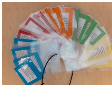
Kuva 4. Toimintakortit.

Suunnittelimme erilaisia vaihtoehtoja päiväkodin yhteiseen ulkotoimintaan, ja kehittämistiimin kanssa niistä toteutettavaksi valikoitui päiväkodin yhteinen liikuntapäivä. Liikuntapäivää varten jokainen ryhmä kehitti yhdessä lasten kanssa liikunnallisen rastin ohjeineen osaamisaluekortteja hyödyntäen. Myös ulkoleikkikoulu ja koululla oleva eskari tulivat mukaan projektiin. Päätettiin, että lasten kanssa kuljetaan rastilta rastille ja ulkoleikkikoulu tekee oman rastinsa matkan varrelle metsään, siirryttäessä koulun ja päiväkodin välillä. Liikuntapäivä suunniteltiin pidettäväksi lokakuussa 2021 ja sitä suunnittelemaan valittiin kunkin päiväkotiryhmän liikuntavastaavat. Päiväkodinjohtaja on listannut erilaisia vastuurooleja, joita olisi hyvä olla päiväkodissa. Yksi näistä rooleista on oman lapsiryhmän liikuntavastaava ja tähän rooliin on päiväkodin jokaisesta lapsiryhmästä saanut ilmoittautua vapaaehtoiseksi yksi aikuinen.