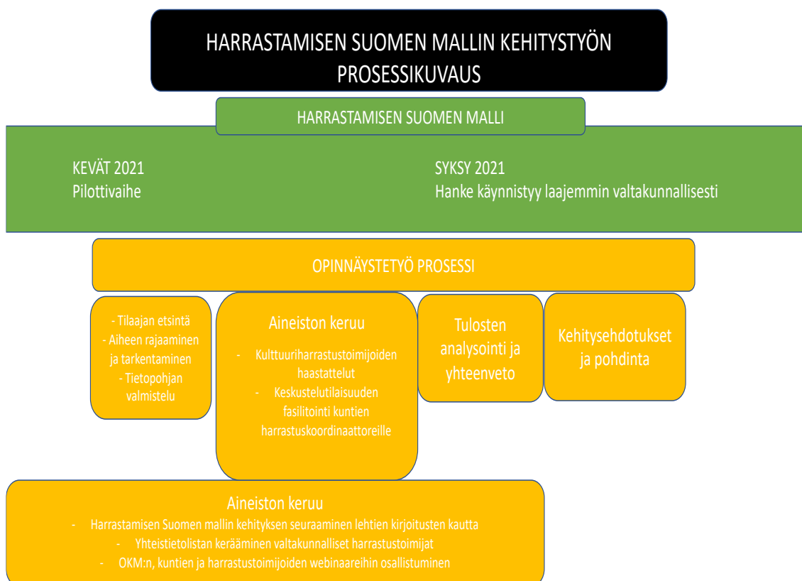
Kuvio 3. Harrastamisen Suomen mallin kehitystyön prosessikuvaus

Tapaustutkimuksen aineistenkeruuprosessi on alkanut jo kesällä 2020, kun julkaistiin tieto, että opetus- ja kulttuuriministeriö on valmistelemassa Suomeen omaa harrastamisen mallia koulupäivän yhteyteen toteutettavien harrastusten mahdollistamiseksi Islannin harrastamismallin pohjalta.