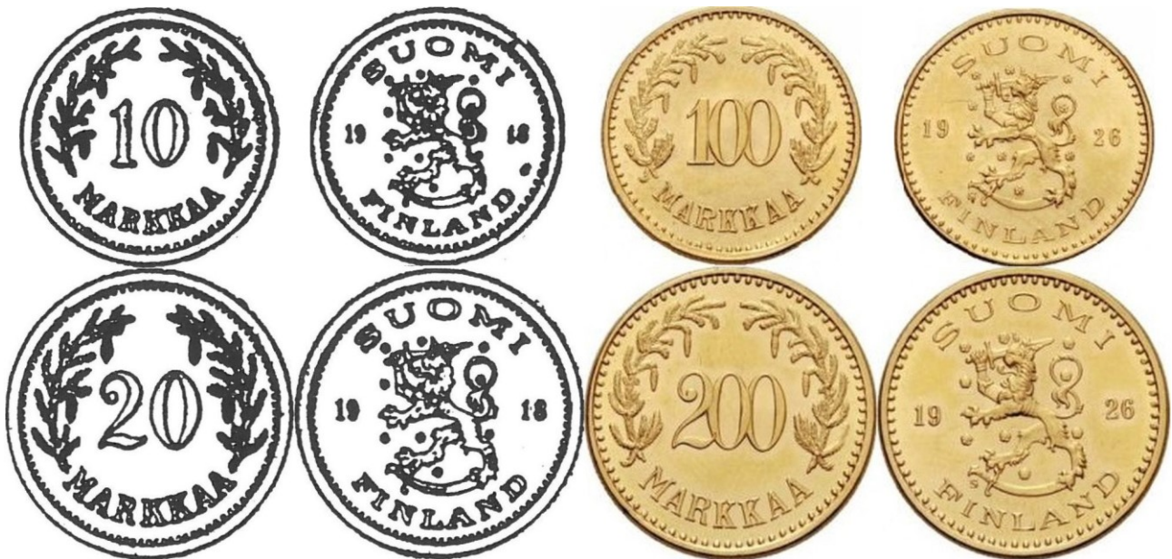
Kuva 4. 10 ja 20 markan rahojen vuoden 1918 suunnitelmien ja sekä 100 ja 200 markan rahojen vuoden 1926 toteutuksen vertailukuva.

Rahan ulkoasua ja parametreja kuvaava säädös julkaistiin 27. maaliskuuta 1926. Kultarahat poikkesivat muista kolikoista siten, että tunnuspuolella oli teksti SUOMI FINLAND (kuten aikaisemman tyyppin 10 ja 20 markan kultarahoissa), mikä osoittaa näiden kolikoiden kansainvälisyyden.