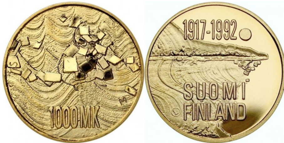
Kuva 5. 1 000 markan juhlakultaraha vuodelta 1992. Halkaisija 22,1 mm, paino 9,0 grammaa 900 o/oo kultaa, lyöntimäärä 35 000 kpl.

Itsenäisyyden 100 markan hopearahat vuodelta 1992 olivat tuolloisen käytännön mukaisesti yleisön ostettavissa rahalaitoksista nimellisarvoonsa 100 markkaa. 1 000 markan juhlakultaraha piti kuitenkin tilata etukäteen ja sen tilanneet saivat lunastaa sen postiennakkolähetyksenä omasta postitoimipaikastaan hintaan 1 067 markkaa, josta nimellisarvon ylittävä osuus 67 markkaa oli toimitus- ja postiennakkokuluja. Tämän jälkeen on Suomessa lyöty kultajuhlarahoja tai kulta/hopea-bimetallijuhlarahoja miltei vuosittain, mutta niiden emissiohinnat ovat olleet huomattavasti rahojen metalli- tai nimellisarvoa korkeampia.