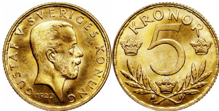
Kuva 2. Ruotsin 5 kruunun kultaraha 1920. Halkaisija 16 mm, paino 2,2402 g 900 o/oo kultaa, lyöntimäärä 103 000 kpl.

Naapurimaassamme, ja tärkeässä kauppakumppanimaassamme, Ruotsissa (joka ei osallistunut ensimmäiseen maailmansotaan) palattiin ensimmäisenä Euroopan maana jo marraskuussa 1922 de facto ja 1. huhtikuuta 1924 de jure sotaa edeltäneeseen kultakantaan. Ruotsin tilannetta kuvaa hyvin se, että Ruotsissa laskettiin vuonna 1920 yleiseen rahaliikenteeseen vanhan standardin mukainen 5 kruunun kultaraha.