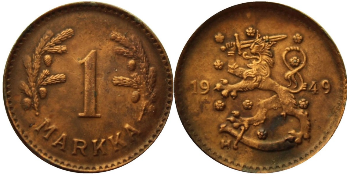
Kuva 12. 1 markka rautaa 1949 tyyppiä SNY 438.2.2 kuparipinnoitettu. Muuten aidon tyyppinen, mutta aitoa hieman keveämpi (noin 3,6 g) ja tarttuu magneettiin, Timo Ruotsalaisen kokoelmista.