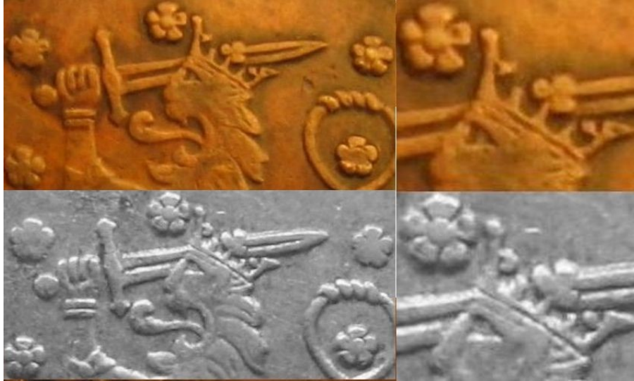
Kuva 11. 1 markka 1949, kupariväärennöksen (ylempi) ja aidon rautarahan tyyppiä SNY 438.5 (alempi) vaakunaleijonan yläosien ja erityisesti kruunujen vertailua.

Kuten kuvasta 11 käy ilmi, on muuten identtisissä vaakunaleijonien yläosissa kuitenkin pieni ero; kruunun etusakaran sivukiemura väärennöksessä on pieni nysä ja aidossa se on selvästi isompi ja pyöreämpi. Onko tämä väärennöksen paljastava virhe vai meistin kulumisesta aiheutuva ero?