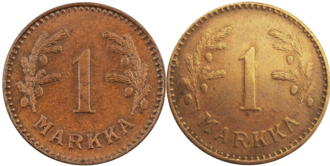
Kuva 5. 1 markka kuparia 1949, aidon (vasemmalla) ja vanhan väärennöksen (oikealla) arvopuolten vertailua. Aidon ja väärän arvopuolet ovat yksityiskohdiltaan saman kaltaiset, mutta väärennöksen arvopuoli vaikuttaa kuitenkin lyödyn joko hieman huolimattomasti kaiverretulla väärennetyllä tai hyvin kuluneella aidolla meistillä, koska monet yksityiskohdat ovat ”pehmentyneet” tai kuluneet pois.

Tutkittaessa väärennöksen reunarihlausta on sanottava, että ensinnäkin se on selkeää ja hyvää tekoa, ja huomaa selkeästi, ettei raha ole ollut normaalissa rahaliikenteessä. Verrattaessa väärennöksen reunaa kuvassa 4 ylempään ja alempaan aitoon rahaan, on rihlojen jako varsin aidon kaltainen, mutta tarkkaan katsottaessa näkyy, että väärennöksen ”hampaat” ovat aitojen rahojen hampaita sirompia ja erityisesti hampaiden välit ovat väärennöksessä aitojen rahojen välejä selvästi leveämpiä. Lisäksi keskellä olevan väärennöksen reunarihlaus on selkeästi terävämpää laatua kuin aitojen rahojen rihlaus. Myös verrokkirahat ovat tavanomaista kulumattomampia, eli tämä ero on syntynyt jo rahoja valmistettaessa.