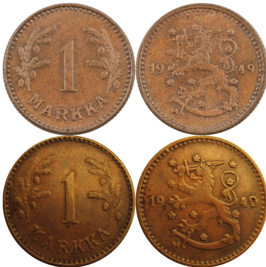
Kuva 3. 1 markka kuparia 1949, aito raha ylempänä ja vanha väärennös alempana. Huomatkaa väärennöksen yleisen ilmeisyyden epätarkkuuden lisäksi väärennöksen jotenkin outo väri ja kiilto, jonka myös Kurt Pettersson toi esille omassa kuvauksessaan.