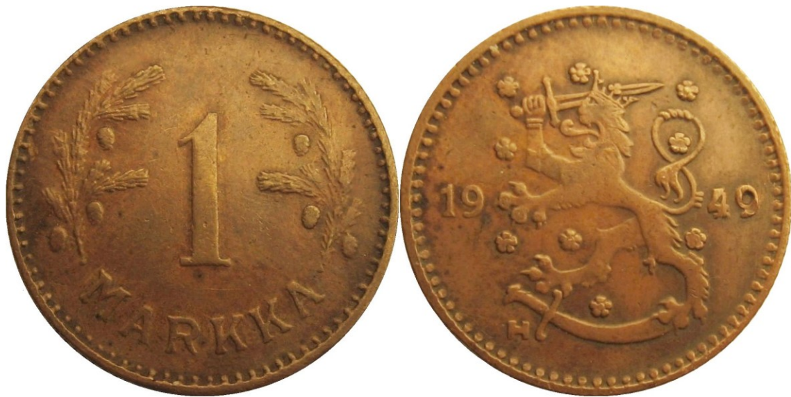
Kuva 2. 1 markka kuparia 1949, vanha väärennös. Huomatkaa vuosiluvun numeron 4 asema leijonan häntäkarvoihin nähden ja jälkimmäisen numero 9:n pyöreä ja pulska alalenkin pää. Myös rahan yleinen ilmiasu on jotenkin epätarkka, kaikki pienet yksityiskohdat (kuten arvopuolen havuneulaset tai tunnuspuolen leijonan vasemman kypälän karvat tai ruusukkeet) ovat hieman epätarkkoja.