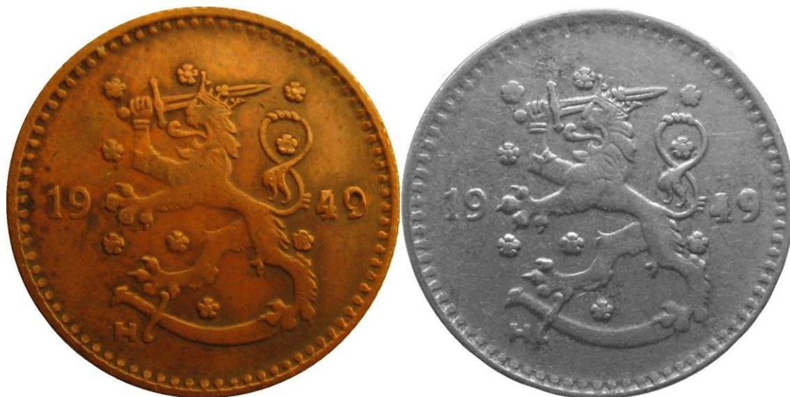
Kuva 9. 1 markka 1949, kupariväärennöksen (vasemmalla) ja aidon rautarahan tyyppiä SNY 438.5 (oikealla) tunnuspuolten vertailua.