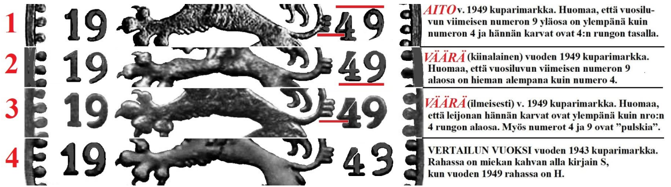
Kuva 1. Havainnekuva 1 markka 1949 kuparia aidon ja kopioiden/väärennösten vuosilukujen eroista. Ylinnä aito raha (1), sen alla yleinen kiinalainen kopio (2), toiseksi alinna vanha väärennös (3) ja alinna vertailun vuoksi 1 markka kuparia 1943.

Sain kesällä 2021 haltuuni vuoden 1949 kuparimarkan väärennöksen, joka oli sekä miltei tarkalleen oikean painoinen (3,95 grammaa) että oikeaa materiaalia eli kuparia. Haltuuni saama raha on selkeästi niin kutsuttu vanha väärennös. Havainnekuvan 1 toiseksi alimpana (kohta 3) on kuvattuna juuri tämän tyyppin väärennöksen vuosiluvun numerot, joista erityisesti kaksi viimeistä numeroa 4 ja 9 ovat aidon rahan vastaavia pulskempia ja erityisesti viimeisen numeron 9 alakärki on aitoa erittäin paljon pyöreämpi. Lisäksi tässä vanhemmassa väärennöksessä on numeron 4 rungon vaakaviiva leijonan hännän alimman karvan tasoa selkeästi alempana.