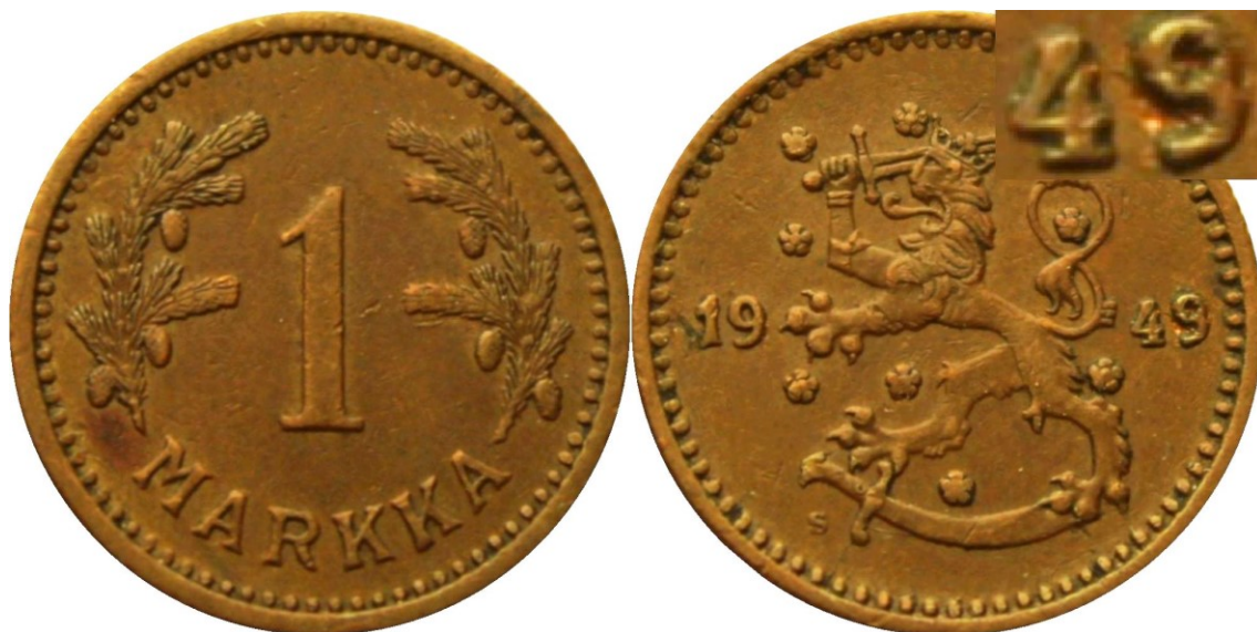
Kuva 14. Loppukuriositeetiksi vielä vuoden 1943 aidosta kuparimarkasta viimeistä numeroa 3 hieman muuttelemalla (katso kuvan oikean yläkulman osasuurennosta) kyhailty varsin onneton vuoden 1949 kuparimarkkaa mukaileva tekele. Tunnuspuolen aivan vääränlaisen viimeisen numero 9:n lisäksi tunnuspuolen vaakunaleijonan miekankahvan alla oleva rahapajan johtajan kirjain S paljastaa vilungin, kirjaimenhan pitäisi olla H, Timo Ruotsalaisen kokoelmista.