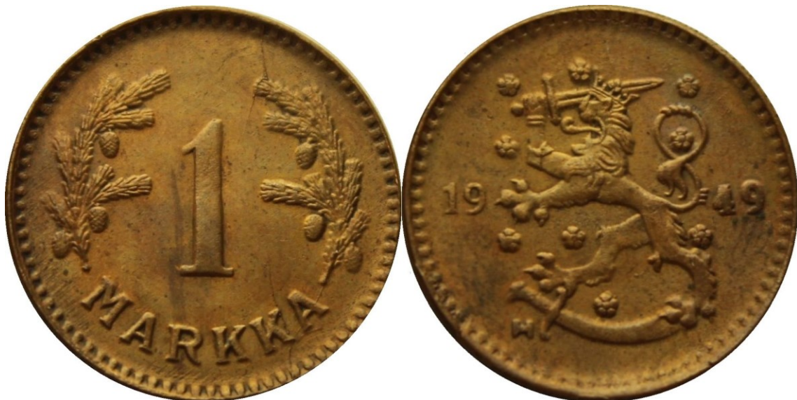
Kuva 13. 1 markka rautaa 1949 tyyppiä SNY 438.5.2 kuparipinnoitettu. Arvopuoli on aidon tyyppinen, mutta tunnuspuoli on samaa väärää tyyppiä kuin kuvan 2 vanha väärennös. Rahaa voisi sanoa vanhan väärennöksen väärennökseksi. Raha on myös aitoa hieman keveämpi (3,46 g) ja tarttuu magneettiin, Timo Ruotsalaisen kokoelmista.