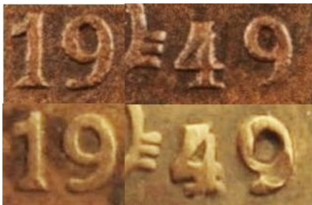
Kuva 8. 1 markka kuparia 1949, aidon (ylinnä) ja vanhan väärennöksen (alinnä) tunnuspuolten vuosilukujen numeroiden yksityiskohtien vertailua.

Kuvien 7 ja 8 avulla on selkeästi havaittavissa vanhan väärennöksen selkein ero aitoon verrattuna, eli numeron 4 pulskeus erityisesti jalan alaosassa sekä jälkimmäisen numero 9:n paksu ja pyöreäpäinen alaosa. Vuosiluvun loppuosaa 49 tutkittaessa ei voi välttyä ajatukselta, että raha on lyöty käyttäen aitoja arvo- ja tunnuspuolen meistejä, mutta tunnuspuolella on käytetty aidosta poikkeavaa tyyppin SNY 438.5 meistiä. Vertailukuvasta 8 myöskin huomaa, että ainakin tämän väärenteen numeroa 4 on ilmeisesti korjailtu suurentamalla sen sisällä olevaa kolmion muotoista aukkoa muistuttamaan paremmin aidon rahan numeroa 4 ja numeron 9 renkaan keskiö on Kurt Petterssonin huomion mukaisesti ikään kuin porattu rahaan parantamaan numeron 9 ilmiä. Myös jälkimmäisen numero 9:n päälle ”sattunut” iskunjälki panee väkisin miettimään, onko sekin jonkinlainen tahallaan tehty hämäys.