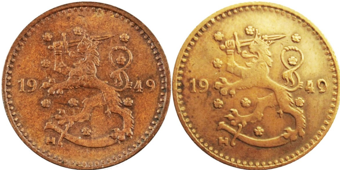
Kuva 7. 1 markka kuparia 1949, aidon (vasemmalla) ja vanhan väärennöksen (oikealla) tunnuspuolten vertailua. Väärennöksen tunnuspuolikin vaikuttaa kuitenkin lyödyn joko hieman huolimattomasti kaiverretulla väärennetyllä tai hyvin kuluneella aidolla meistillä, koska monet yksityiskohdat (esimerkiksi leijonan vasemman käpälän karvat tai ruusukkeet) ovat ”pehmentyneet” tai kuluneet pois.