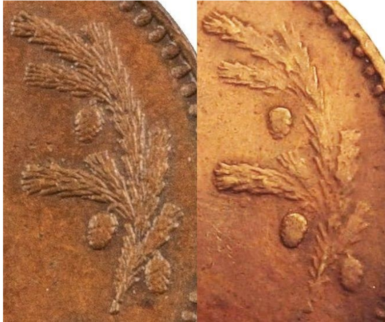
Kuva 6. 1 markka kuparia 1949, aidon (vasemmalla) ja vanhan väärennöksen (oikealla) arvopuolten oikeanpuoleisen havuoksen yksityiskohtien vertailua. Onko oikean puolimmainen havunoksa joko huolimattomasti kaiverrettu väärennösmeisti vai hyvin kulunut aito meisti?