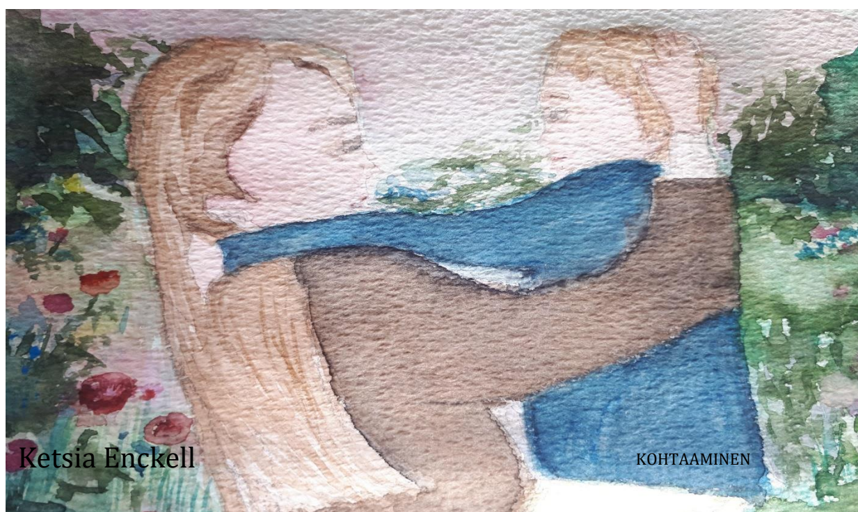
Kuva 3. Aito kohtaaminen, Ketsia Enckell

Musiikkikasvattaja toimii peilauspintana lapsien lisäksi myös nuorille, aikuisille ja iäkkäille heidän eri elämänvaiheissaan. Hellsten kuvaa, että: