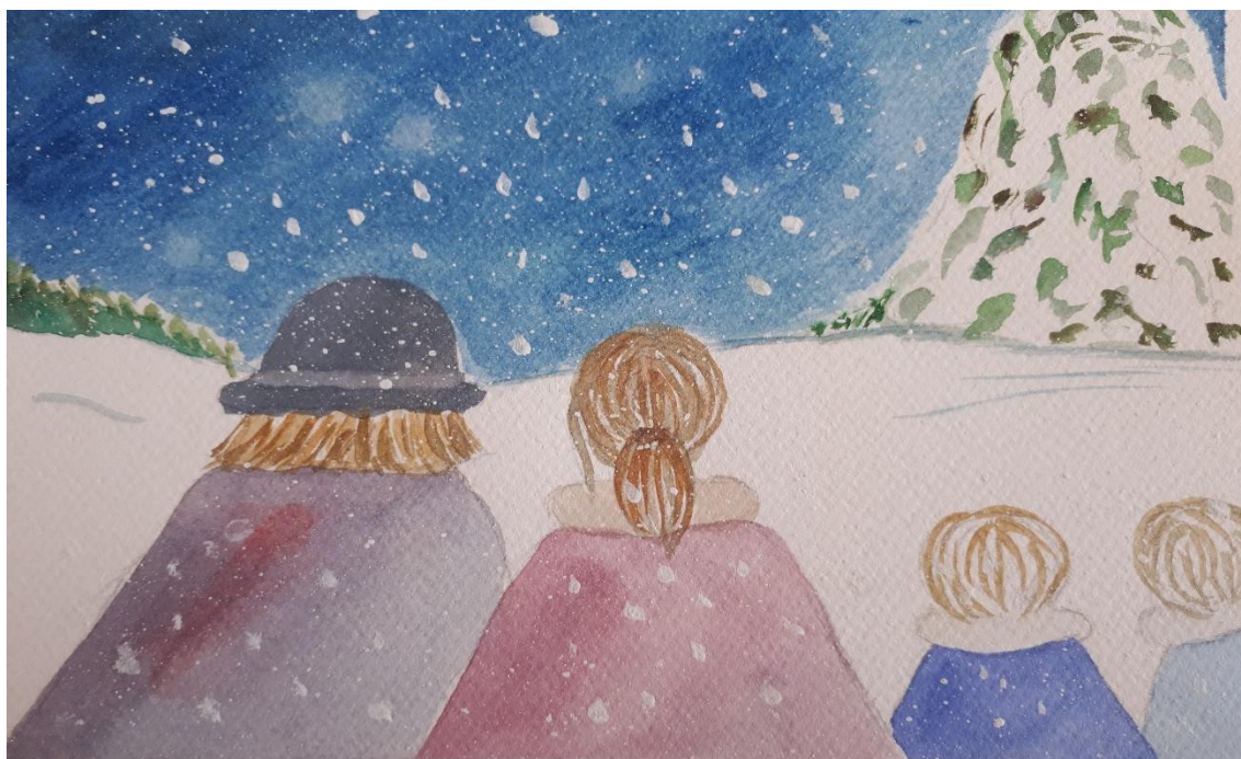
Kuva 1. "Ihme" Ketsia Enckell 2020

Valmistuvasta kirjasta muodostuu kaunokirjallinen musiikkia sisältä kehitysromaani, jonka tarinat ja laulut ovat kohdennettu perheille, mutta niitä voi myös käyttää musiikkitoiminnassa. Osa tarinoista sisältävät lauluja ja sävellysehdotuksia, joita voi kuunnella, kuten aiemman pääluvun "Luovuuden koti" esimerkissä.