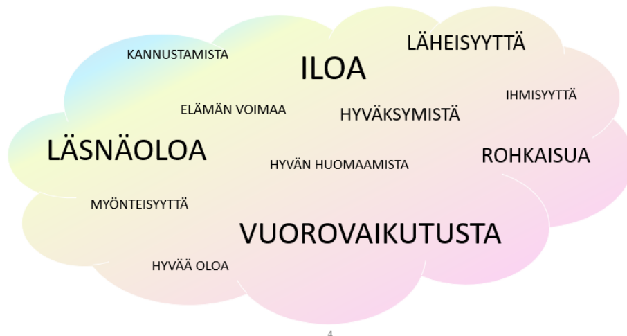
Kuva 1. Positiivisen pedagogiikan sanapilvi

Varhaiskasvatuksen opettajat sekä lastenhoitajat pitävät positiivista pedagogiikkaa vuorohoidossa rikkautena, jonka kautta pystytään tarjoamaan lapselle hyvät edellytykset elämään. Vuorovaikutus heijastuu ennen kaikkea ihmisten välisissä kohtaamisissa, jolloin myönteisen vuorovaikutuksen merkitys on suuri (Leskisenoja 2019, 37). Joillakin lapsilla ei ole mahdollisuutta kotona kokea läheisyyttä, läsnäoloa tai myönteisen vuorovaikutuksen hyviä puolia, jolloin vuorohoidossa korostuu ennen kaikkea se, että lapsi kokee itsensä näh-